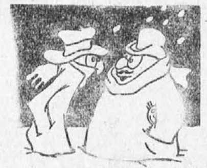
— V moji domovini je dva metra snega. — V vaši domovini je dva metra snega. — V vaši domovini je dva metra snega.

slovci pa bržčas nikoli več ne bodo pripravili tako nevhvaležnega in nezanesljivega poskusa.