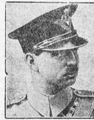
Bivši romunski kralj Karol

Bivši romunski kralj Karol in gospa Lupescu, ki sta po polomu v Romuniji zbežala, živita že dalj časa v Lisaboni