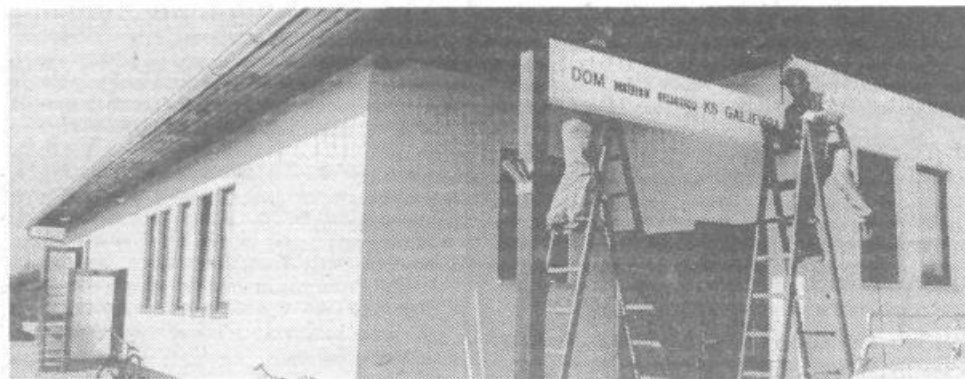
Prej je bila kot vsaka druga montažna hiša, zdaj, z napisom, pa je postala tudi uradno dom krajanov KS Galjevica. In to je res njihov dom, saj so ga zgradili z lastnim delom in le z nekaj pomoči iz občinskega žaklja.