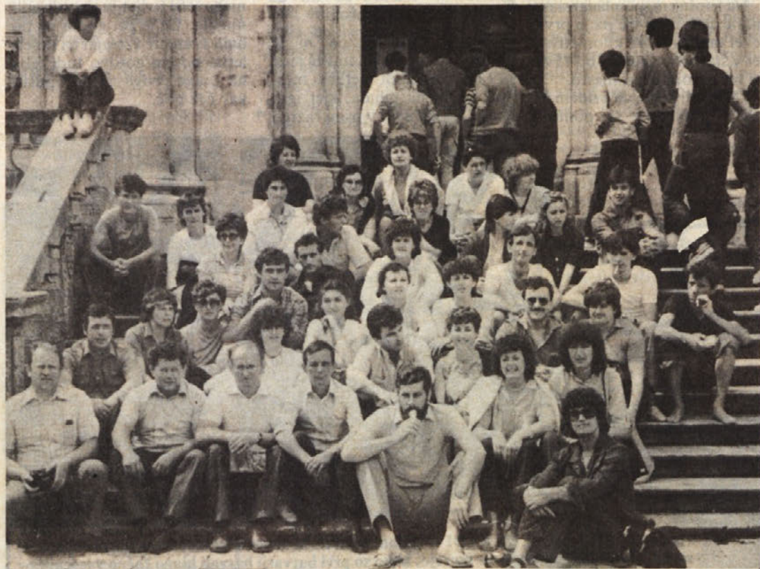
POUČNO IN ZANIMIVO, A KRATKO — Po zadovoljnih obrazih sodeč lahko trdimò, da nobeden od udeležencev izleta teh kamnitih stopnic ne bi zamenjal za direktorski fotelj.

...da so nadvse zanimive primerjave z avstrijskimi cenami. Tako velja v hotelu B kategorije v Avstriji goveja juha 64,50 dinarjev, pri nas 35, dunajski zrezek velja v sosednji državi 344, pri nas 200 din, biftek 387 din, 300 dinarjev v našem hotelu, liter belega vina v Avstriji 387, pri nas 200 dinarjev, kava v Avstriji 94,60 dinarjev, pri nas 30 dinarjev, steklenica cocacole prek meje 77,40 dinarjev, pri nas 50 dinarjev (1 šiling = 4,30 dinarja). Torej — naše cene so resnični adut naše turistične ponudbe v letošnjem letu.