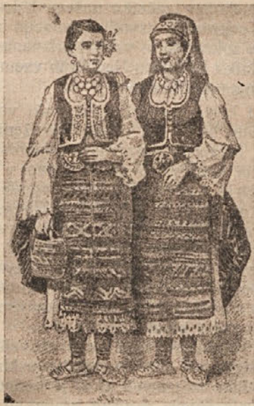
Narodna noša beograjskega okrožja.

Tam, glej, dekleta, reprezentantke v narodni noši beograjskega okruha. Mična lepota, izrazitost zdravja srbskih mater in srbskega ljudstva. V čipkah, z zlatom obšito sukno na gibčnem, elastičnem telesu. Tam stopa muslimanka iz Macedonije, to je iz Stare Srbije, iz Smiljeva. Stasita, v očeh ogenj jurga, šalvare iz težke svile, vablivo zvezane v gležnjih in obuta v razkošne sandale. Plašč v rdečem žamet, ves z zlato obšito ornamentiko. Zopet tam je narodna noša s Kumanova, s Prilepa, s Šumadije.