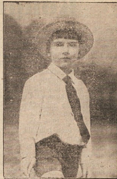
Kralj Peter II.

»V XX. stoletju še nismo mogli priti do zavesti, da je naša krščanska dolžnost preprečiti vsako vojno. Vi ste najvidnejši dokument, da ne smemo več dopustiti, da bi zopet nastalo klanje ljudi. Vi ste najvidnejša slika, ki zahteva, da mora biti mir, svetovni mir, mir med ljudmi in narodi. Ali ni krščanska sramota in sramota človeštva, če še nismo prišli do tiste odločnosti, da se ne bomo več klali. Civilizacija ni bila sposobna preprečiti barbarstva, še pomagala je in še pomaga, da se danes dela povsod, v zraku, na zemlji, na vodi, pod vodo, pod zemljo, povsod samo to, kako bi se moglo hitreje in groznejše uničiti človeka in narode. Po vojni vidimo, kakšne so posledice. Duševni in moralni padec na