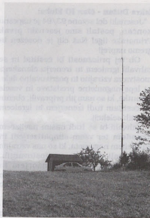
Koča pri Gabrku - rezultat enoletnega dela CB kluba "Ahac"

Naši sponzorji pa so: Optim d. o. o., Transport, Galvanska oprema-Plama d. o. o., Izoterm-Plama d. o. o., Elektro Sežana, Romi bar, Prodaja plina Nada