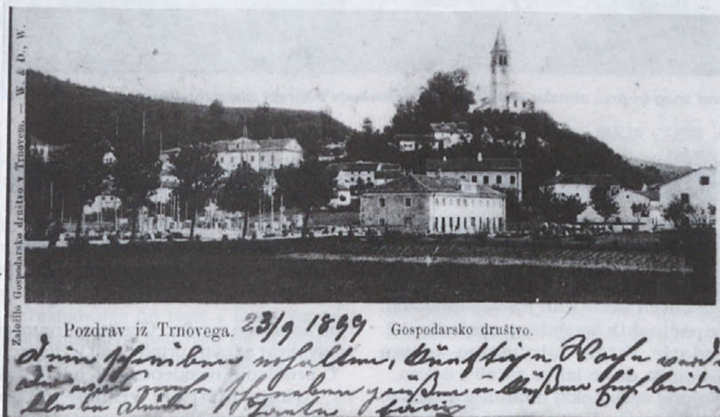
Stavba Gospodarskega društva v Trnovem, kjer je pred devetdesetimi leti začela z rednim delom trnavska pošta.

O selitvah pošte, nesrečnih preobrazbah njenega imena od Trnovo na Kranjskem, Dornegg in Krain, Torrenova di Bisterza-Istria, Torrenova del Nevoso-Fiume, pa do imena Trnovo pri Ilirski Bistrici po II. svetovni vojni, o