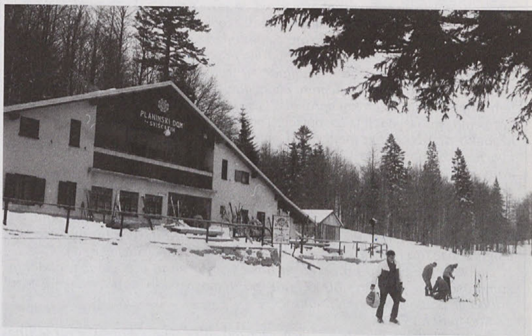
Planinski dom na Sviščakih

pričakovanja novega leta del noči preživeli ob kresu in ognjemetu (brez petard!).