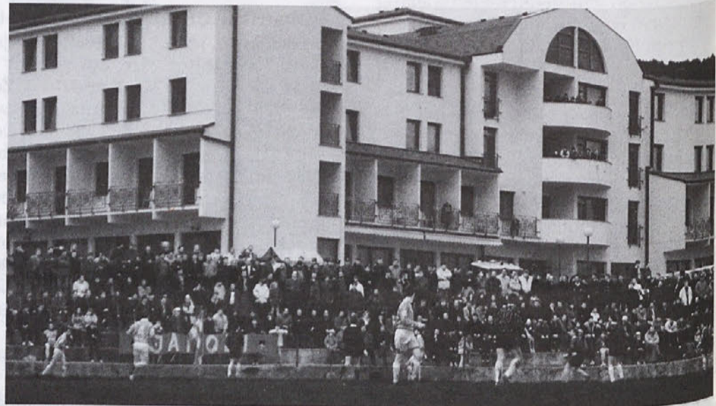
Številno občinstvo z navijači Japodi na čelu, ki redno in burno spremlja igro Transportove ekipe na "na kampotu"

slišati. Nogometna žoga je bila na zadnjem mestu. Sedaj pa se je nekaj v meni spremenilo, tako da ima sedaj z mano težave tudi moja soproga. No, ampak z njo bom že uredil; vsako tekmo si moram pač ogledati. Najpomembnejše je, da Transport zmaguje in da smo postali jesenski prvaki. Z zadovoljstvom gledam, kako je na "kampotu" iz nedelje v nedeljo več gledalcev, zato upravi kluba in trenerju sporočam, naj ekipo kar najbolje pripravi za drugi del tekmovanja, da se uvrstimo v tretjo slovensko ligo."