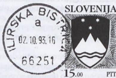
Poštna žiga trnavske pošte z datumom 2. 10. 1903 in na isti dan po 90 letih, 2. 10. 1993. Kako prepoznati, da gre za isto pošto v istem kraju?

V sredo, 8. decembra 1993, je bila na slovesnosti Turistične zveze Slovenije v Novi Gorici POŠTA TRNOVO (66251 Ilirska Bistrica) v svoji kategoriji proglašena za najboljšo pošto v Sloveniji. Urejenost pošte, organiziranost dela, prijaznost in domačnost pošte in delavk je ocenjevalo kar nekaj komisij vse leto in pošto visoko ocenilo.