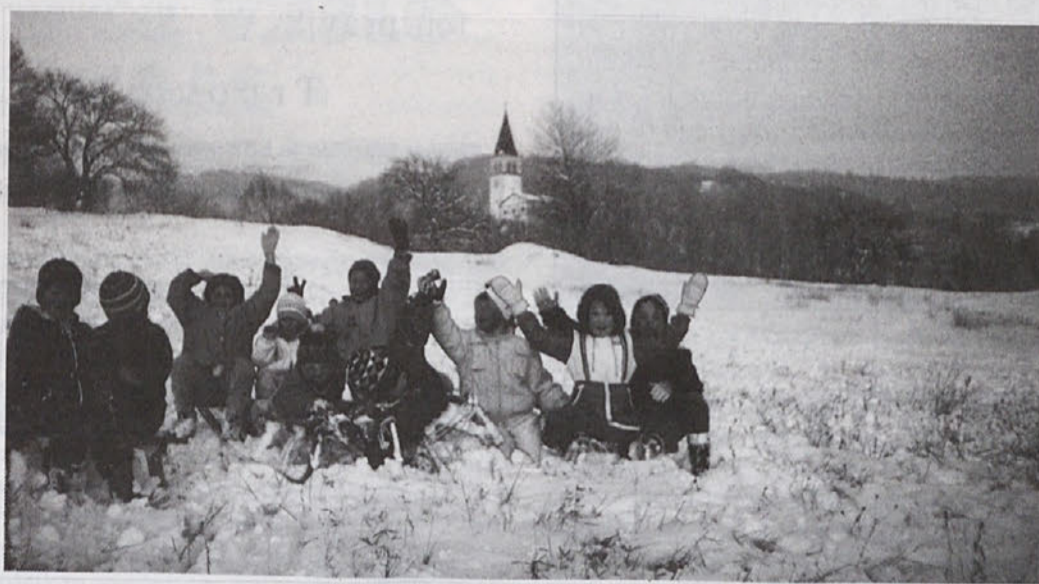
Prvi sneg in prvo zimsko veselje na Hribu svobode v Ilirski Bistrici