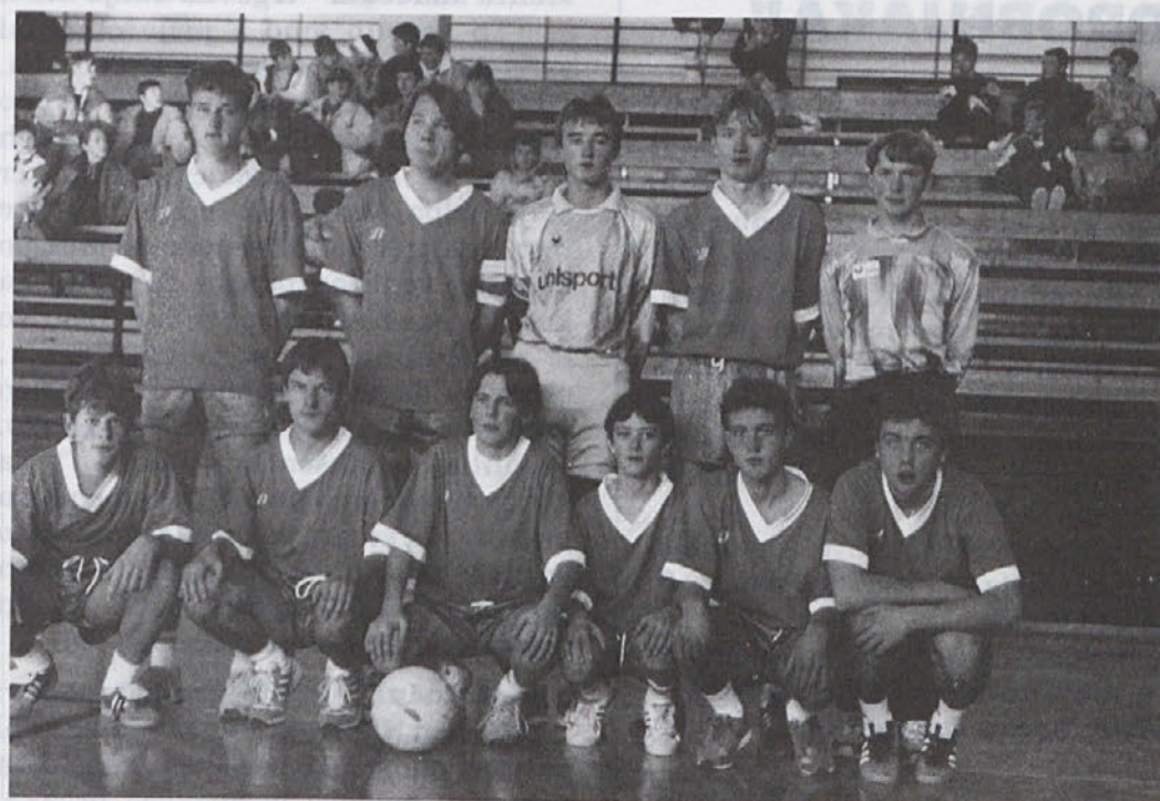
Kadeti NK Transport

Logar, Perutninski kombinat Pivka, Javor Bač, Vida Kovačič-Gostišče Korajžnik, Zavarovalnica Triglav, Centro Radio Trieste in Grafični atelje Zejnulović.