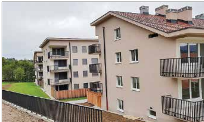
V celotnem stanovanjsko poslovnem objektu Podrožnik se nahaja 74 stanovanjskih in tri poslovne enote. (Fotodokumentacija SGP Graditelj)

V celotnem SPO Podrožnik se nahaja 74 stanovanjskih in tri poslovne enote. Stanovanjske so različnih velikosti, in sicer od enote z enim ležiščem do tistih s štirimi ležišči. V že zgrajenih lamelah je še na voljo nekaj takoj vseljivih sta-