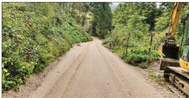
Obnovljena cesta v Kotah pred asfaltiranjem