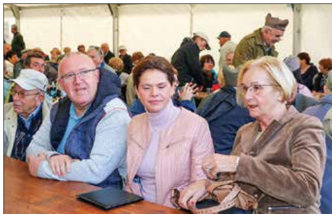
Na Čreti je bila slavnostna govornica mag. Alenka Bratušek , ministrica za infrastrukturo (druga z desne), na sliki v družbi nazarskega župana Mateja Pečovnika (tretji z desne).

Slavnostna govornica mag. Alenka Bratušek , ministrica za in-