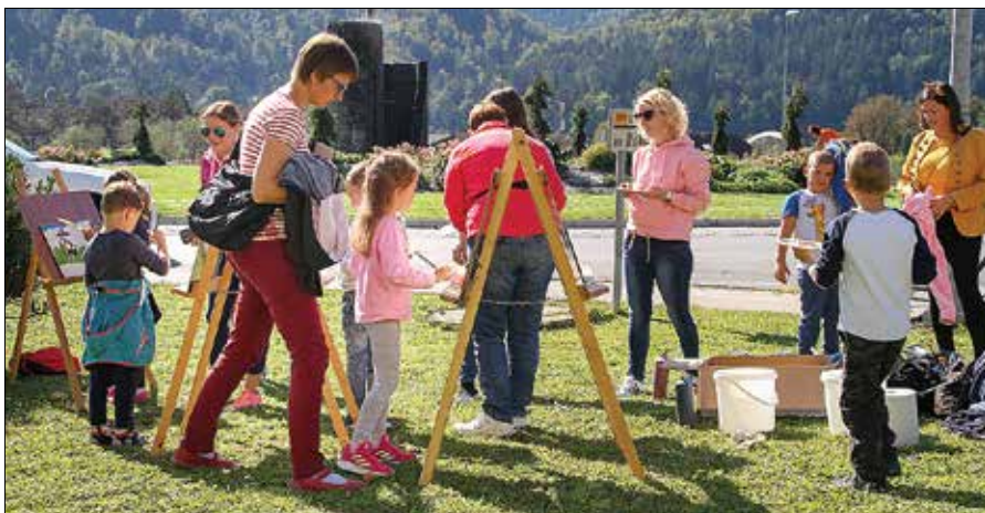
Otroci so letos kot motiv najraje izbirali skulpturo sv. Jurija sredi krožišča ob Upravnem centru Mozirje.

V okviru 13. likovne kolonije, ki jo vsako leto organizira vzgojno osebje mozirskega vrtca, je letos 20 otrok z vodstvom mentoric z uporabo različnih likovnih tehnik slikalo vzdolž mozirskega trga. Sprejelo jih je toplo sončno vreme in značilni motivi, po delu pa ogled igrice Žabji zbor.