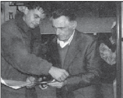
50 let planinskega društva Gornji Grad

Oktober 2000: V Gornjem Gradu so planinci praznovanje društvenega »abrahama« povežali z otvoritvijo novih prostorov.