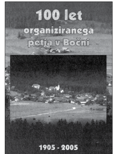
Brošura, ki so jo Bočani izdali ob stoletnem jubileju organiziranega petja

Junij 2005: V obnovljenem kulturnem domu v Bočni so v sklopu občinskega praznika pripravili slovesnost ob 100. obletnici organiziranega zborovskega petja in 10. obletnici prireditve Pesem pomladi.