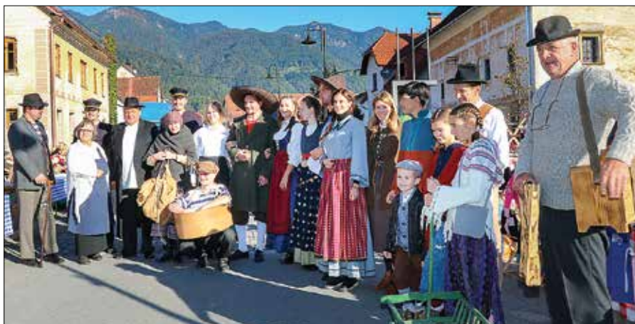
Za popestritev sejemskega dogajanja so poskrbeli številni liki.

Med štanti so se sprehajali liki tedanjega časa. Tu in tam se je ustavila številna kmečka