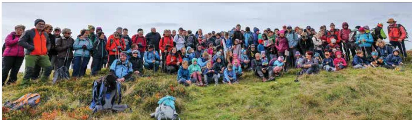
Na Smrekovec je prišlo mlado in staro.

Dogodek pripravljajo občine Ljubno, Šoštanj in Črna na Koroškem, ki se izmenjujejo pri organizaciji, planinska društva Ljubno ob Savinji, Velenje, Šoštanj in Črna na Koroškem ter Naravovarstvena zveza Smrekovec. Pri izvedbi med drugimi sodeluje tudi Savinjsko gozdarsko društvo in Dom na Smrekovcu.