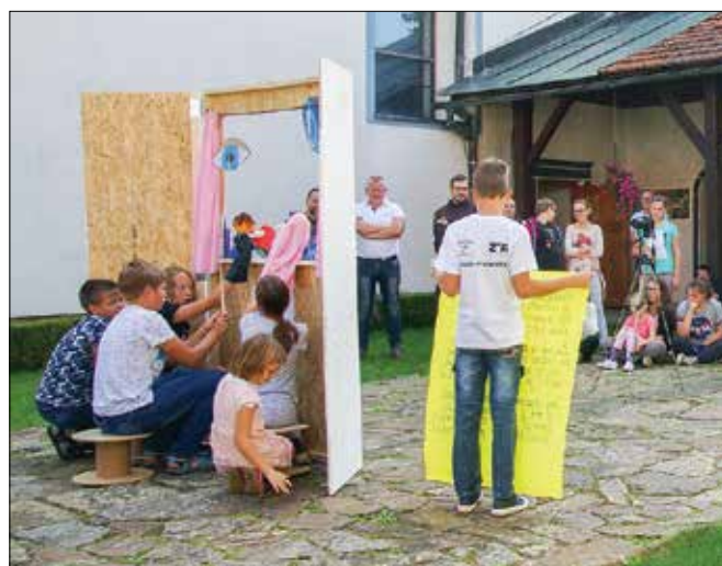
Župnijski dan so sklenili v samostanskem atriju z družabnimi igrami.

govih del. Letos namreč obeležujemo 200 let od smrti prvega slovenskega pesnika, ki je, ko je stopil v frančiškanski red, noviciat opravljal prav v Nazarjah. Vsak zaselek se je predstavil z njegovo pe-