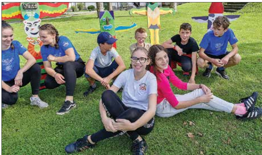
Radoživo vzdušje med mladimi »kiparji« na Jamnikovi koloniji