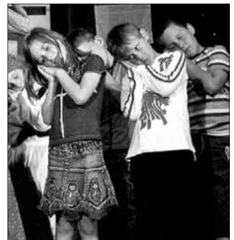
Slavnostna akademija je bila sklepno dejanje praznovanj ob pomembnih obletnicah gornjegrajske šole

Oktober 2010: Konec oktobra so Gornjegrajci pripravili proslavo ob 130. obletnici