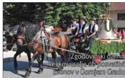
Po skoraj sto letih v zvoniku gornjegrajske katedrale zadoneli novi zvonovi