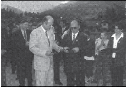
Gornjegrajska kotlovnica, vzorčni projekt ogrevanja

Julij 1998: Ob zaključku občinskega praznovanja so se Gornjegrajci razveselili pionirske pridobitve za vso Slovenijo, najso-dobnejše kotlovnice za daljinsko ogrevanje na podlagi izkoriščanja lesnih odpadkov.