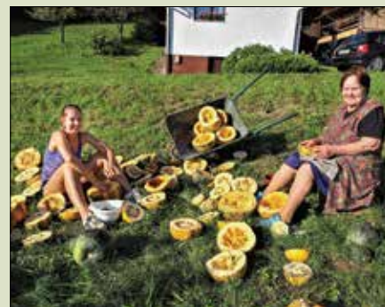
Žnidarjevi babica Angelca in vnukinja iz Kolovrata sta pred dnevi pobirali in trebili buče golice.

Prišel je čas pobiranja sadov in darov narave. Letošnja letina ni zelo spodbudna za sadjarje niti ne za vrtnarje, če ne gre za intenzivno pridelavo, kjer uporabljajo najboljše metode in zaščite. Vrtničarji so bili zadovoljni z letino paradižnika, a je tudi ta že v zadnjih izdihljajih zaradi pojava krompirjeve plesni.