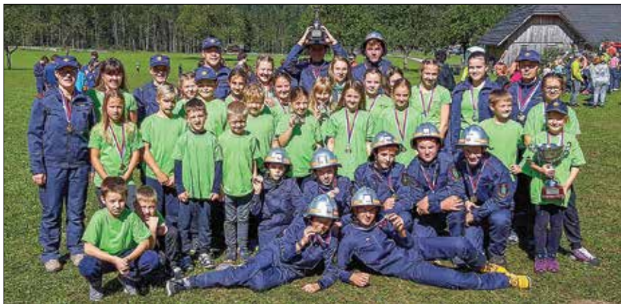
Mladi tekmovalci in njihovi mentorji iz PGD Luče