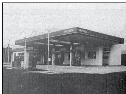
Končno do želene (in obljudljene) črpalka

Julij 1994: Po dolgih letih čakanja in zaradi različnih vzrokov vedno znova nerea-