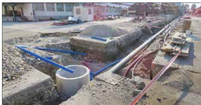
Prenovitevna dela na toplovodu v coni Glin v Nazarjah

va del Nazarj vse od večstanovanjskih objektov, osnovne šole in zdravstvenega doma do objektov nekaterih individualnih odjemalcev. Izvedli so kompletno zamenjavo toplovoda in ob tem v zemljo vkopali tudi rezervni vod za morebitne druge napeljave komunalne infrastrukture. Predvidena investicijska vrednost del znaša okoli 90 tisoč evrov.