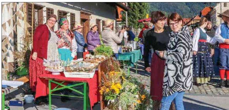
Da je bila stojnica s pecivom in različnimi sladkimi dobrotami še bolj vabljava, so jo branjevke okrasile s cvetjem.