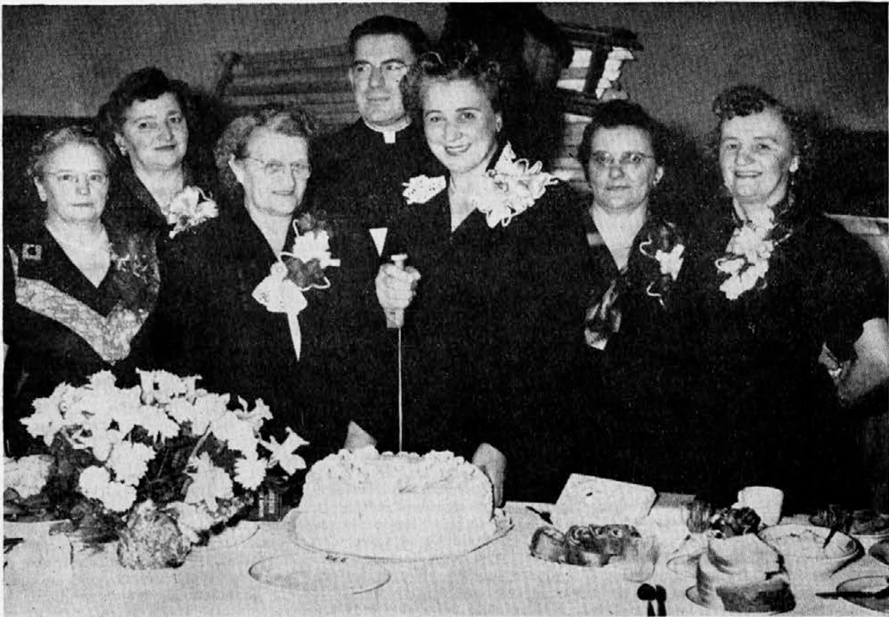
NA BANKETU PROSLAVE OBLETNICE ŠT. 67, BESSEMER, PA.