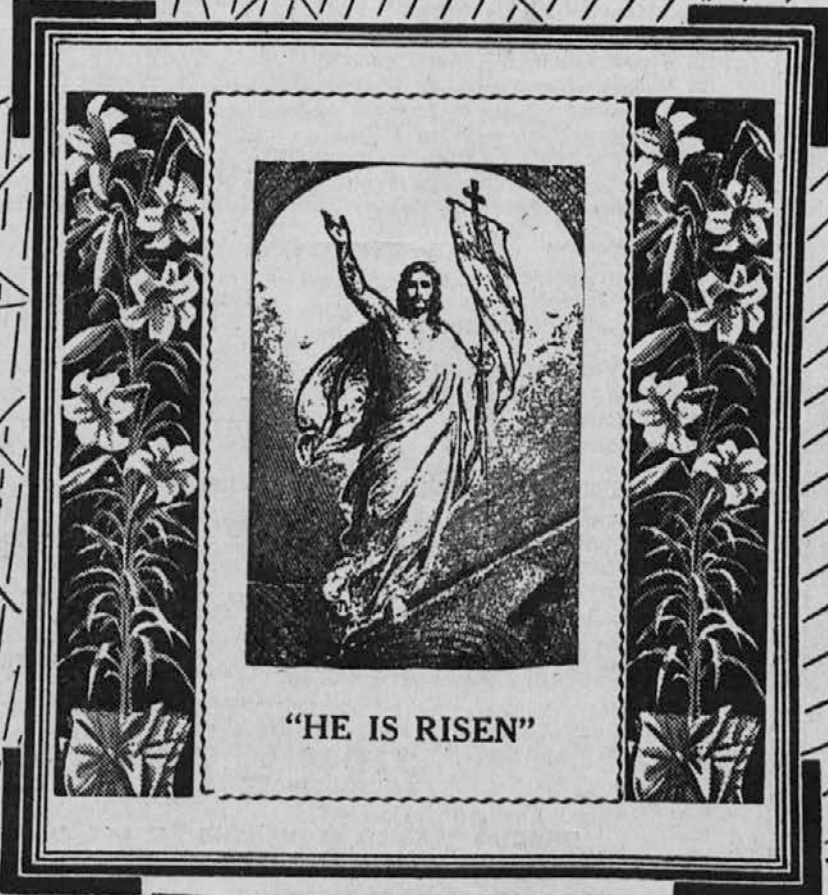
"HE IS RISEN"

GLASILO SLOVENSKE ŽENSKÉ ZVEZE V AMERIKI