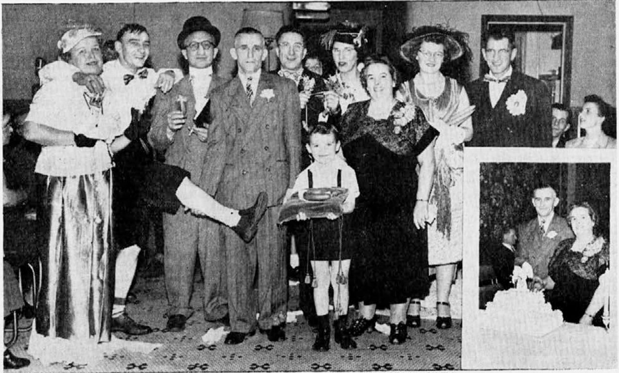
MOCK WEDDING GROUP, DULUTH, MINNESOTA