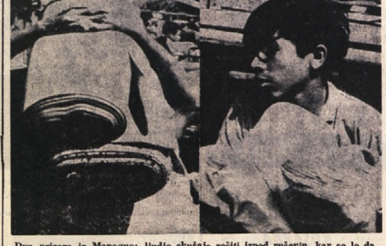
Dva prizora iz Manague: ljudje skušajo rešiti izpod ruševin, kar se le da, pa naj jim predmet služ ali ne

Ponovni potresni sunki - Ustreljena skupina ljudi, ki je plenila med ruševinami