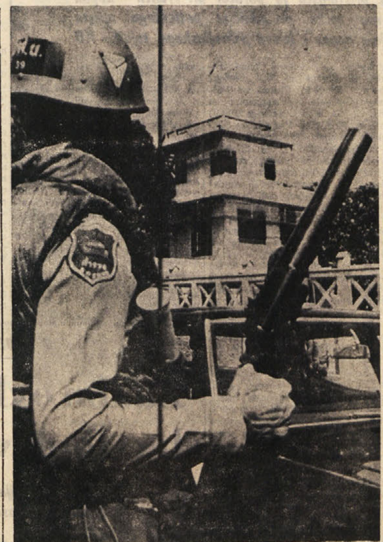
Verilci palestinskega «Crnega septembra» so vdrl v izraelsko veleposlanstvo v Bangkoku na Tajskem ter zajeli šest talcev. Pozajanja z oblasti so se vedno v teku. Na sliki: tajski vojak pred izraelskim veleposlanstvom. Podrobno poročilo o dogodku objavljamo na 6. strani