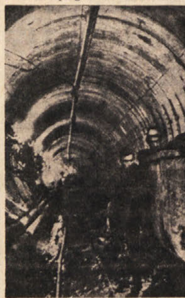
Gradnja proge sever - juž se je začela

zemeljsko železnico tudi pod Donavo in moderna podzemeljska železnica zmore promet enega vlaka s 550 potniki vsaki dve minuti in pol, kar prav gotovo veliko zaleže, pa čeprav to še ni dokončna rešitev. V zadnjih dveh letih, odkar je bil v prometu prvi del proge Vzhod - Zahod na dolžini 6,5 km, je metro prepeljal na dan okoli 250 tisoč potnikov. Mestna uprava pa je uvidela, da to ni dovolj in da je treba progo podaljšati, da bi podzemeljska železnica mogla prepeljati na dan vsaj pol milijona potnikov. Zato so se takoj lotili načrtov dela, ki so ga končali pred nekaj dnevi. To pa še ni rečeno, da je Budimpešta svoje zadevne probleme rešila. V načrtu so še nova dela. Preden spregovorimo o novih nač-