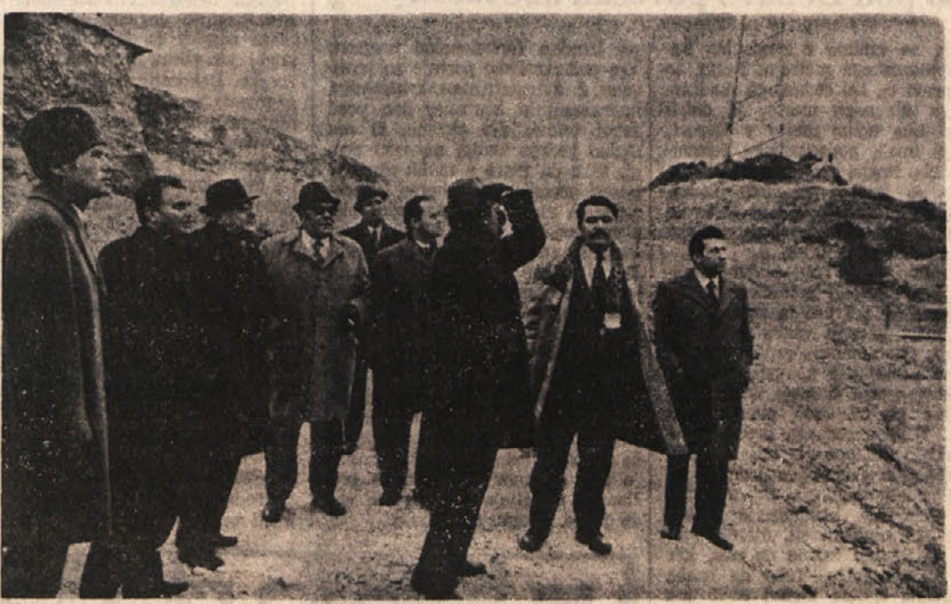
Jugoslovanski in italijanski predstavniki si ogledujejo gradbišče avtocestnega priključka v Sovodnjah

Priključek Vileše-Gorica bo dograjen v začetku 1974. leta, mejni prehod pa bodo začeli graditi spomladi 1973. leta