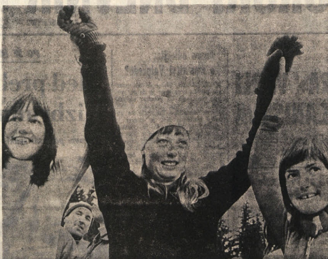
Na mariborskem mednarodnem ženskem smučarskem tekmovanju za «Zlato lisico» bo veljalo glavno zanimanje Avstrijki Pröllovi (na sliki v sredini med Totschnigovo — levo — in Rouvierovo — desno)

TENIS MELBOURNE, 28. — Na mednarodnem teniškem prvenstvu Avstrali je so v četrtfinalu moških posameznikov izločili tudi Sovjeta Metrevalja.