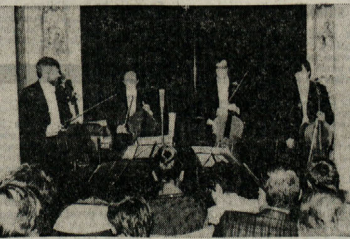
Kvartet violončelov na koncertu v Gallusovi dvoranci GM