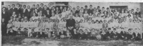
Marijin vrtec v Sv. Rupertu n. Laškem.

Marijin vrtec v Sv. Rupertu n. L. šteje: 103+97=200 otrok; imajo vsak mesec skupno pobožnost: sv. obhajilo in malo prireditev. 70 je naročenih na »Angelčkas«, ki ga z velikim veseljem prebirajo. (O, ko bi bilo v vsaki fari toliko naročnikov! Sliko morem priobčiti samo eno. — Ur.)