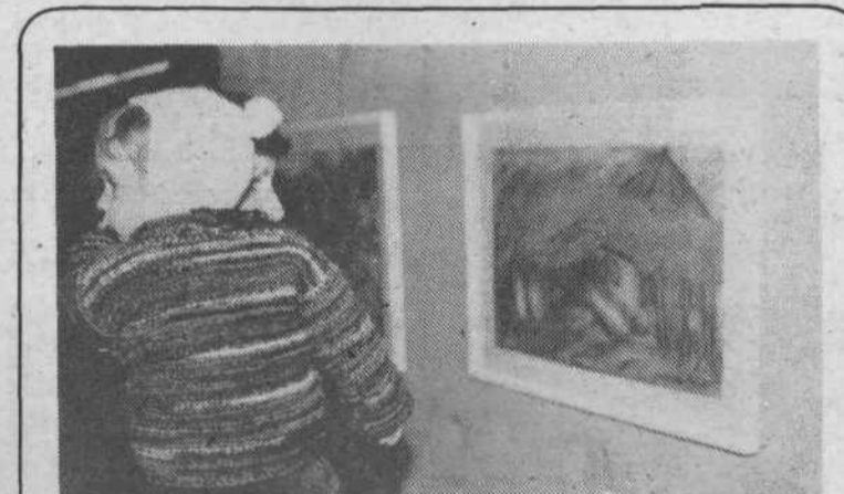
Številni obiskovalci Kliničnega centra si z velikim zanimanjem ogledujejo likovne razstave.