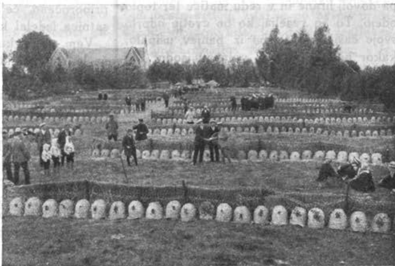
Veenendaalski čebelni semenj.

V pokrajinah Zeeland, Zuid Holland, Nord Holland, Gelderland, Friesland in Groningen pridelajo mnogo deteljinega medu. V pokrajinah Gelderland, Friesland,