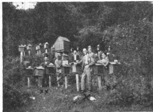
Del plemenilne postaje g. Strgarja v Bitnjah (X Van der Brock)

Privedlo ga je semkaj veliko zanimanje za našo čebelo, da se osebno prepriča, pod kakšnimi pogoji jo vzrejamo in kateri činitelji vplivajo na njen značaj in na njene lastnosti. Brook je namreč velik prijatelj naše čebele in je preskrbel, da je bil pri-