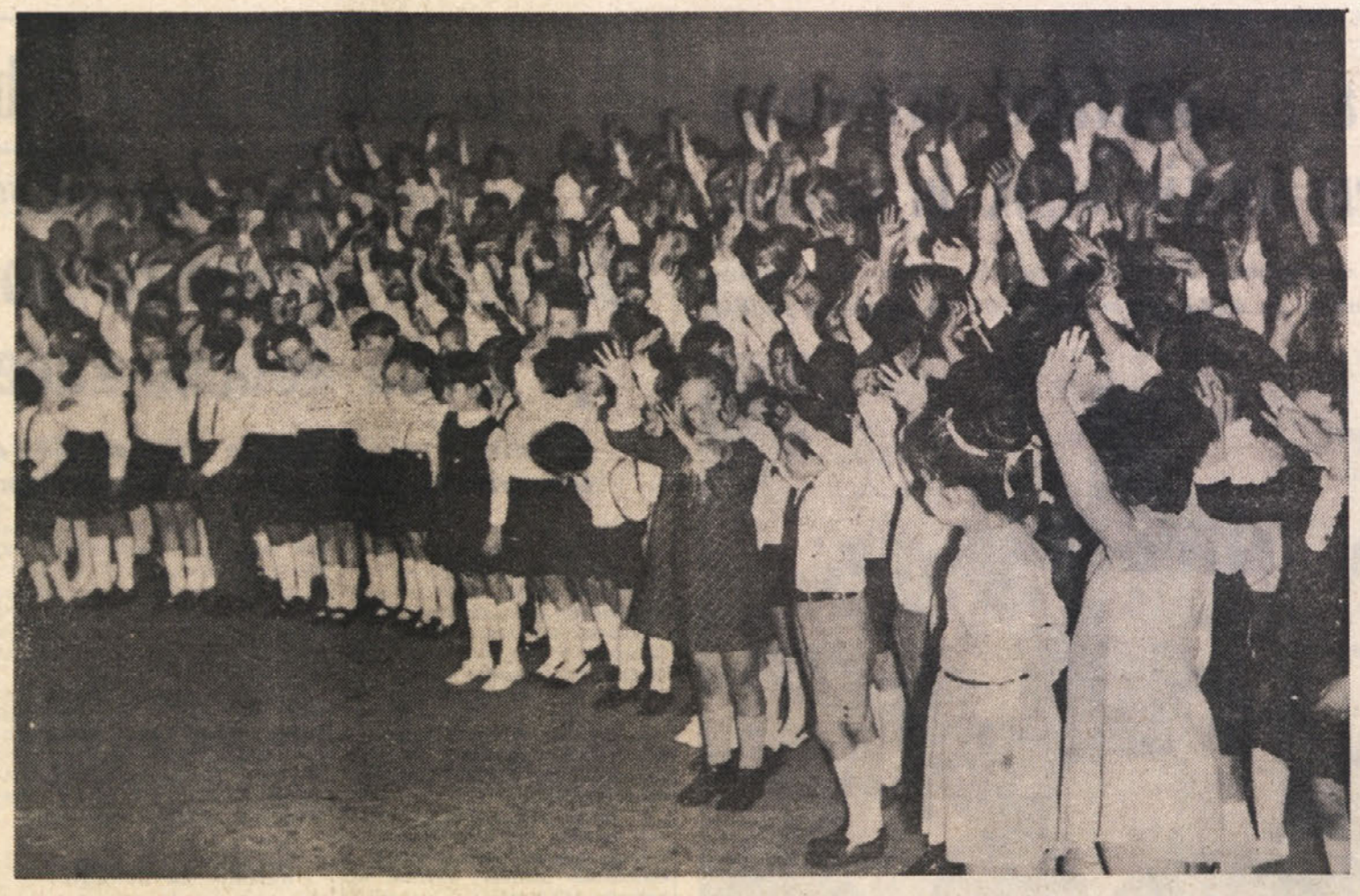
Otroci osnovnih šol, ki so na sobotni prireditvi ob 25. obletnici obnove naše šole v Kulturnem domu kot zaključek prireditve skupno zapeli venček narodnih pesmi