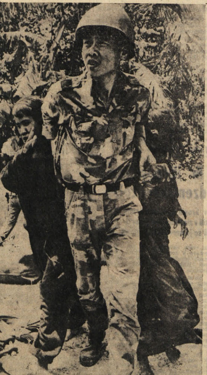
Tako — Južnovietnamski vojak s silo vleče dva otroka v taborišče. Na podoben in včasih še bolj nečloveški način praznijo južnovietnamski vojaki vasi v južni Kambodži in še žive ljudi speljejo v taborišča.