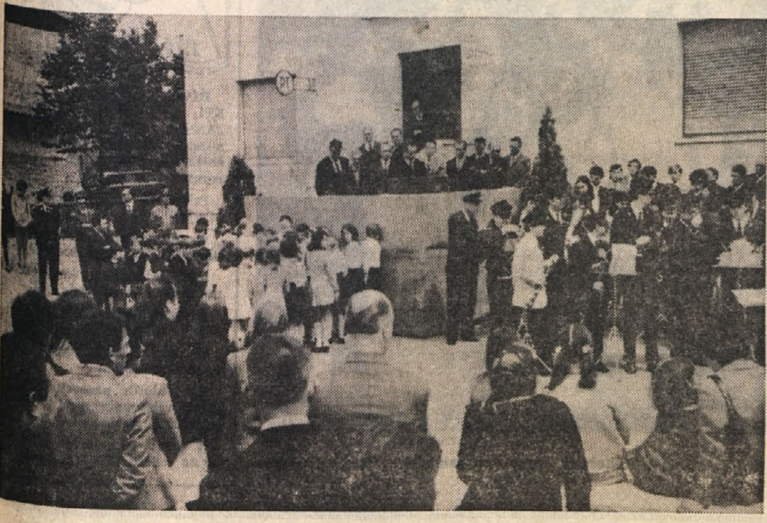
Med nedeljsko slovesnostjo pred županstvom v Zgoniku

Nastopila sta tudi pevski zbor «Rdeča zvezda» in proseška godba - Razveseljivo ugovolnivo - Zaprisega mladine in šopki cvetja najmlajših ob spomenik padlim