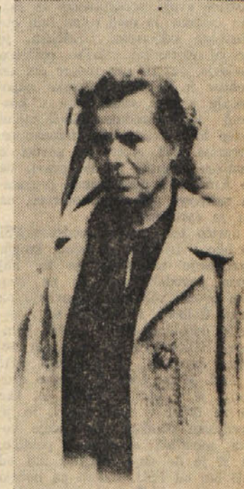
Komunistične literature iz Ljublja-ne v Italijo.

Del te literature, ki jo je Regent prejemal iz Jugoslavije, je «Malka prek svojih dveh kanalov sprav-ljala v Italijo». — piše Regent — «del so jo z nosili čez mejo tova-rišice, ki so prihajali iz Italije, nekaj te literature pa so odnesli na Pri-morsko nekateri člani organizacije TIGR. Malka je morala vsa ko-munistično literaturo prenesti v ho-stel iz postolja, kjer je imela Jugo-slovska matica svoje prostore.»