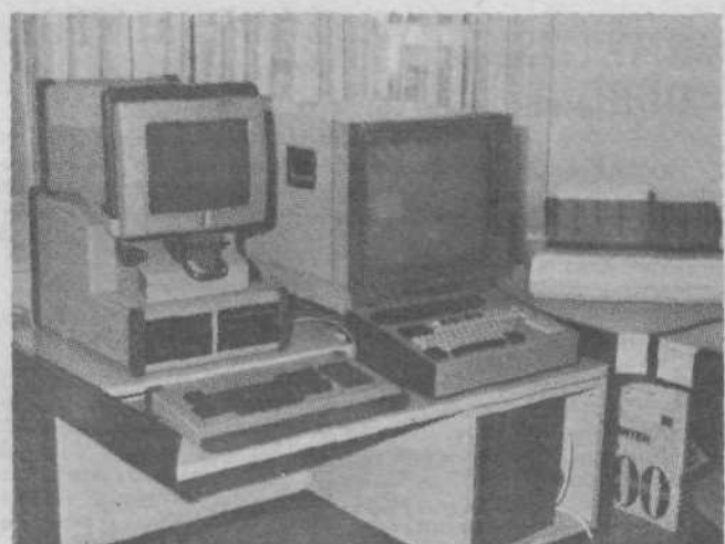
Procesno vodenje vodovodnega sistema Grosuplje.