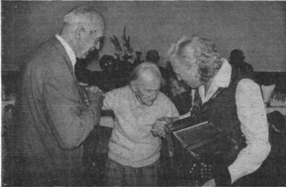
S prirčnega slavlja v Domu starejših občanov.