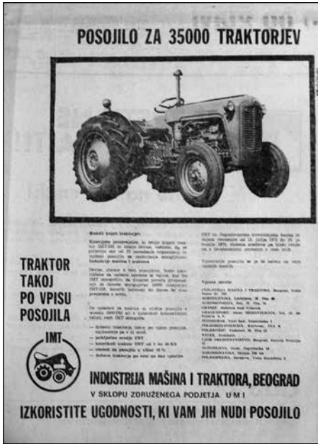
Delo, 29. 6. 1972, str. 9.