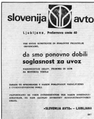
V Ljubljani se priporočamo vsem komitentom in sporočamo, da bomo tudi letos uvozili nekaj rezervnih delov. Delo , 13. 2. 1965, str. 15.