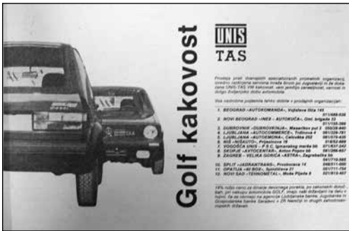
Golf kakovost s 14-odstotnim popustom za devizna vplačila naših državljanov na začasnem delu v tujini. Delo, 13. 12. 1984, str. 15.