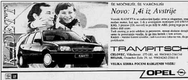
1, 4 i iz Avstrije, Delo , 22. 11. 1989, str. 22.

naša je pravica«. V dnevnem časopisju so ves čas svoje blago oglaševali trgovci iz bližnjih tujih krajev, kako je tedaj svoje usluge ponujalo domače podjetje, pa lahko vidite na fotografiji. Konec osemdesetih let so avstrijske avtohiše oglaševale tudi avtomobile. 633