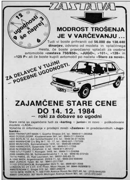
Oglas, namenjen delavcem v tujini, je zanimiv zaradi »udarnega« slogana »Modrost trošenja je v varčevanju«. Delo, 4. 12. 1984, str. 5.