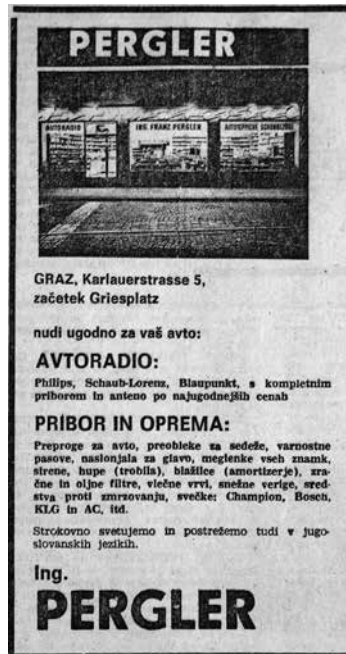
V Gradcu vam strokovno postrežemo v jugoslovanskih jezikih, tudi v Trstu s tem nimamo težav. Delo , 1. 5. 1972, str. 23.