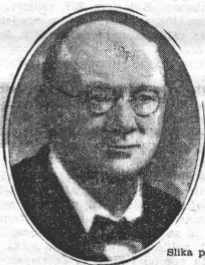
Slika po »Jutr«