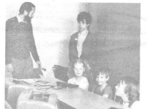
POSKUSNA SKUPINA CICIBANOV PRED RAČUNALNIKI – Kar se Janezek nauči, Janez zna – velja tudi za znanje in poznavanje računalnikov.

Skupaj z vodstvom naših združenih vrtcev so izbrali skupino šestletnikov iz starega trnovskega vrta. Zanje so pripravili poseben program, ki ga spoznavajo dvakrat tedensko po dve šolski uri. Odziv otrok je še boljši kot so pričakovali in z nekaj več individualnega dela so se »računalniške šole« lotili vsi otroci. V skupini jih je 18. Sedanji odziv in program sta pokazala, da bi lahko za te otroke pripravili še en program, seveda nadaljevanje sedanjega. Seveda je pri tem vprašanje denarja, saj stane organizacija sedanjega tečaja 140.000 dinarjev. Polovico je primaknil vrtec, polovico stroškov pa kridravec, polovico stroškov pa krije Inštitut Jožefa Štefana. Za otroke oziroma njihove starše je tečaj brezplačen.