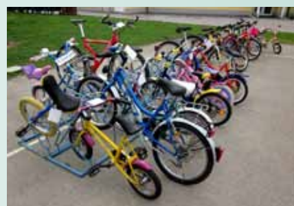
Ponudba je bila pestra.

Besedilo in foto: Nika Marenč Smučarsko društvo Strahovica