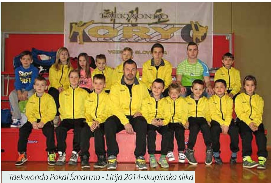
Taekwondo Pokal Šmartno - Litija 2014-skupinska slika