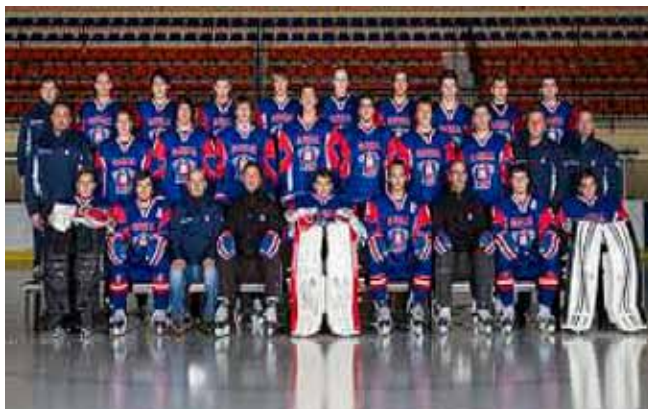
Besedilo: Miro Oberstar

V nadaljnji karieri mu želimo še veliko športnih uspehov.