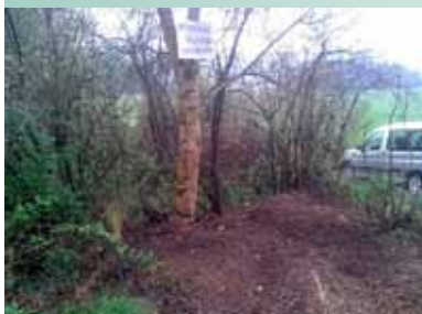
Očiščeno odlagališče kompostnih odpadkov v Utiku

Količina zbranih odpadkov na vsakoletni čistilni akciji kaže zadovoljive rezultate. Glede na pretekla leta je občina Vodice vsako leto bolj urejena, čistejša, še vedno pa se pojavljajo posamezna odlagališča, ki kazijo podobo Vodice. Zato pozivamo občanke in občane, da odpadke deponirajo na mesta, ki služijo v ta namen (Začasni zbirni center Vodice, Snaga ...). S tem boste prispevali največ, kar lahko.