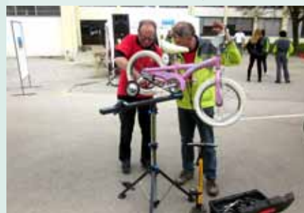
Poskrbljeno je bilo tudi za servis koles.