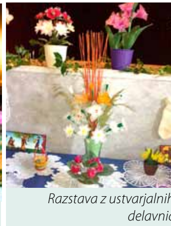
Razstava z ustvarjalnih delavnic