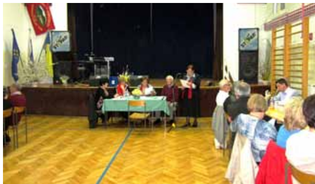
Delovno predsedstvo občnega zbora z gosti