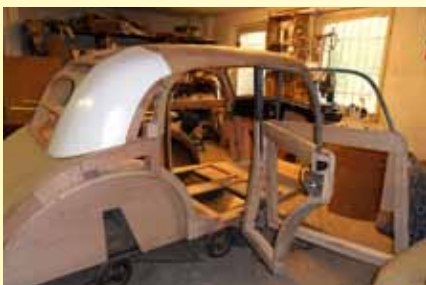
DKW-F7, letnik 1937 v fazi restavriranja

Prav o tem bi vam radi danes povedali nekaj več. Vsi iz našega MAK kluba imamo namreč poleg novejših jeklenih konjičkov tudi starodobne, lepo restavrirane avtomobile in motorje iz tistih časov. Preko celega leta jim posvečamo vso skrb in nego, saj s tem ohranjamo bogato tehnično kulturo na Slovenskem.