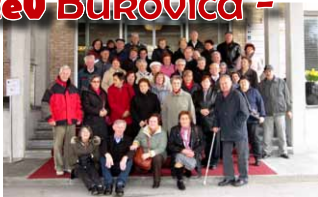
Udeleženci izleta pred gradom Brdo