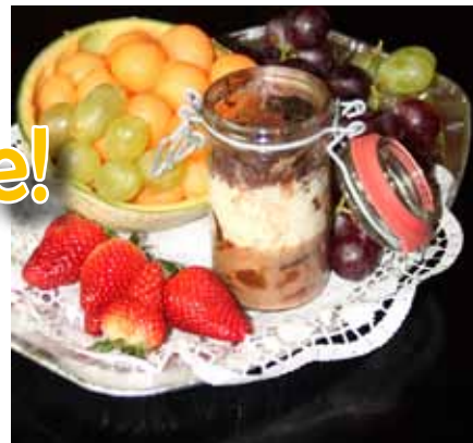
Vsi odtenki čokolade in malinov preliv so v »čokoladnem tegl'cu« navdušili klene gasilke!

Ženske postajajo samozavestnejše in čedne posameznice niso več predmet razkazovanja, pač pa osebe, ki vse pogosteje zasedajo vidnejša delovna mesta, tudi pogovorno moška. Zadreg ob dejstvu, da se znajo prepustiti kuharskim in slaščičarskim mojstrovina moških, ki zmorejo pričarati pravljico na krožniku ali v stekleni posodici,