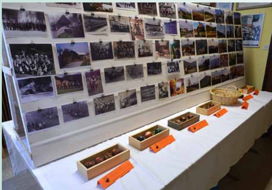
Poleg pirhov je bila letos še razstava starih fotografij.

Turistično društvo Vodice je na velikonočni ponedeljek, 21. aprila, pripravilo 8. velikonočno razstavo. V prostorih PGD Polje je v polnosti idej zaživela čudovita razstava pirhov in ostalih dobrot. Tokrat pa so se na ogled postavile tudi stare fotografije naših krajev.