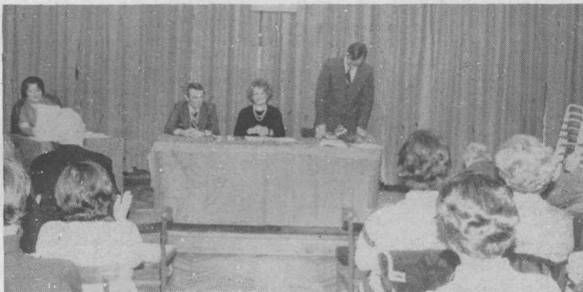
KK SZDL STARI VODMAT

Krajevna konferenca je ves čas ustvarjalno sodelovala v utrjevanju samoupravne preobrazbe krajevne skupnosti kot bistvenega elementa