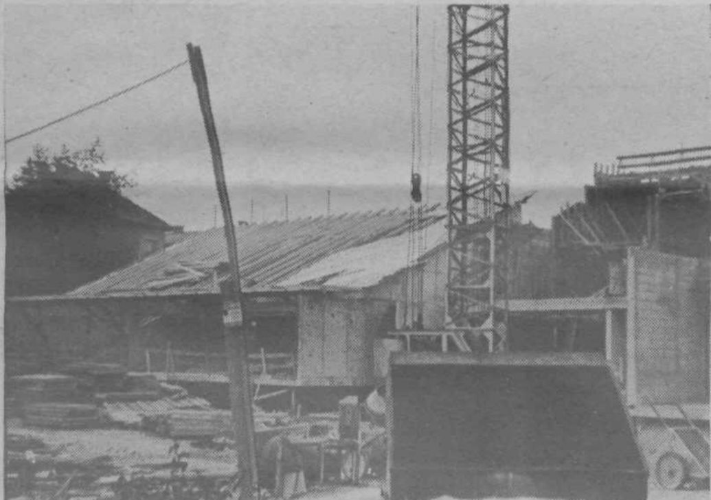
Vrtec na Kodeljevem bo sprejel pod streho 220 otrok. V naslednjih petih letih pa bo potrebno v tej KS zgraditi še najmanj en vrtec — seveda če bomo izglasovali samoprispevek.