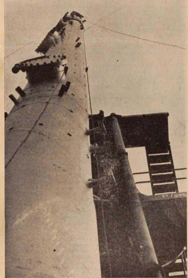
Ceprav je bilo delo tvegano, so lendavski naftovci s svojo mehanizacijo postavili gigantske kolone v vertikalni položaj.

Vhod v jugoslovanski paviljon na minulem graškem velesjemu. Paviljon je najlepši na razstavišču.