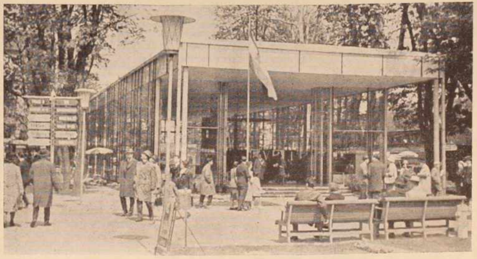
Vhod v jugoslovanski paviljon na minulem graškem velesjemu. Paviljon je najlepši na razstavišču.

Med 13. in 16. majem močno deževje z ohladitvijo, sneg skoraj do nižin. V ostalem deloma sončno s pogostimi krajevnimi nevihtami. Dr. V. M.