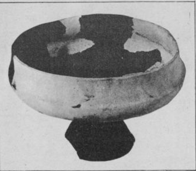
Posoda na nogi iz Ormoža, ki priča o naseljenosti tudi v starejši železni dobi, konec 7. stol., PMP.

Razvita je bila tudi cela vrsta obrti. Tako je bilo dobro razvito lončarstvo, za kar nam govori vrsta keramičnega posodja, lončarji pa so žgali tudi raznovrsten ognjiščni inventar, prenosno ognjišče, ražen in pekač.