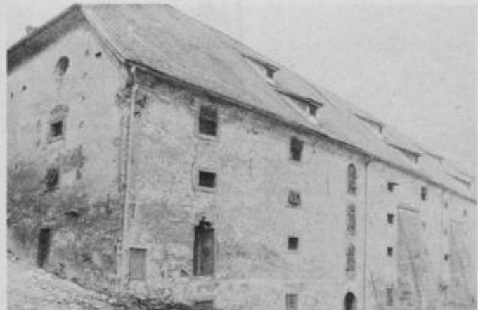
Nekdanja grajska žitnica