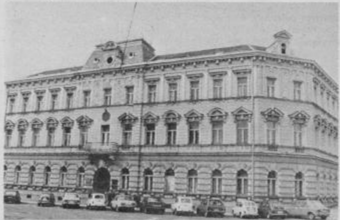
Stavba Skupščine občine Ptuj