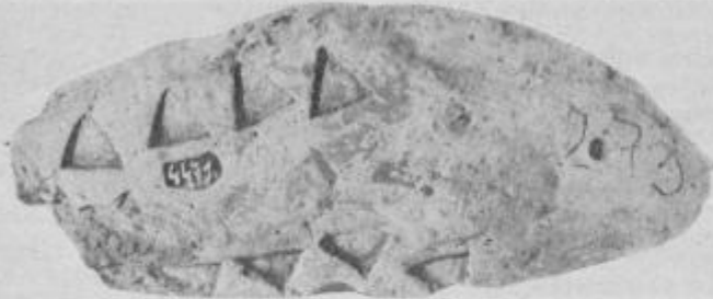
Zoomorfna plastika, prazgodovinska naselbina Ormož, 8. stol. pr. n. št., PMP.

Drugače je morala biti zavarovana ormoška naselbina v ravnini na rečni terasi. Z južne strani jo je varovala reka Drava, z drugih pa sta jo v polkrogu obdajala obrambni jarek in nasip, ki sta še danes na SV strani dobro vidna v dolžini ca. 300 m. Sistematična izkopavanja so odkrila sicer posamezne ostanke iz eneolitika in srednje bronaste dobe, vendar je v zaključni bronasti dobi (kulturi žarnih grobišč) tem prostoru prvič postavljena naselbina s pravokotno zasnovanimi hišami in stavbami, ki se nizajo okrog pravokotno sekajočih se ulic. Da gre