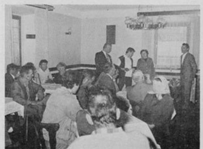
V gostišču Jeruzalem so se zbrali delavci Kombinata. Priznanja za delo- vno zvestobo je prejelo več delavcev.