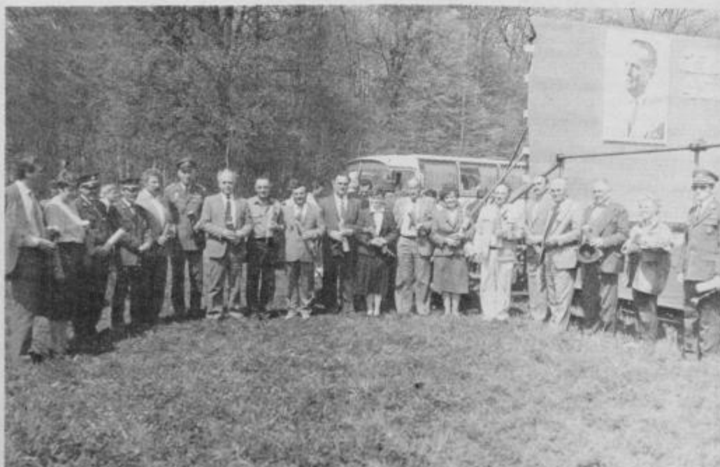
Letošnji dobitniki srebrnega znaka OF.