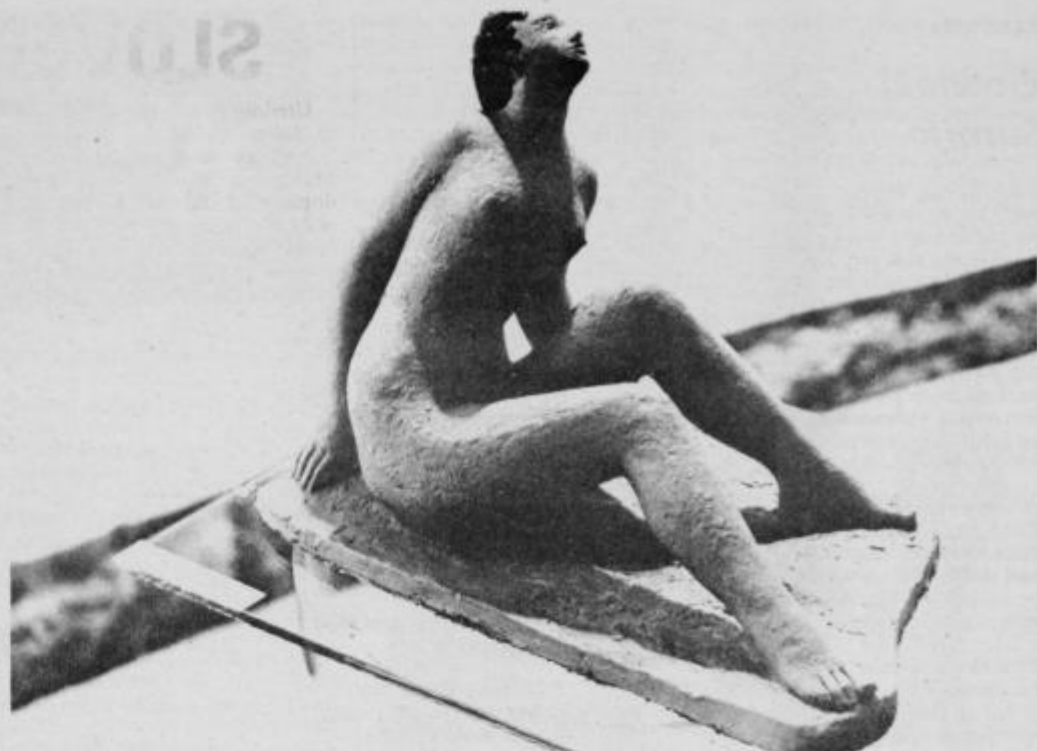
posnetek I. Ciani