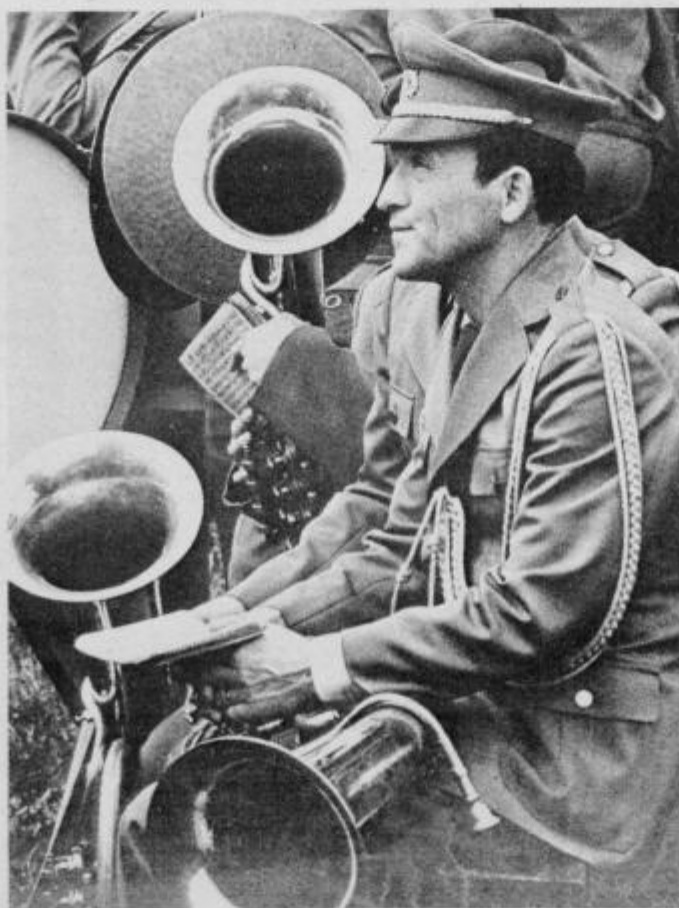
posnetek I. Ciani

Smreka je vedno zelena, misel je vedno le ena. Misel je vedno le ta, da te Ivan rad ima.