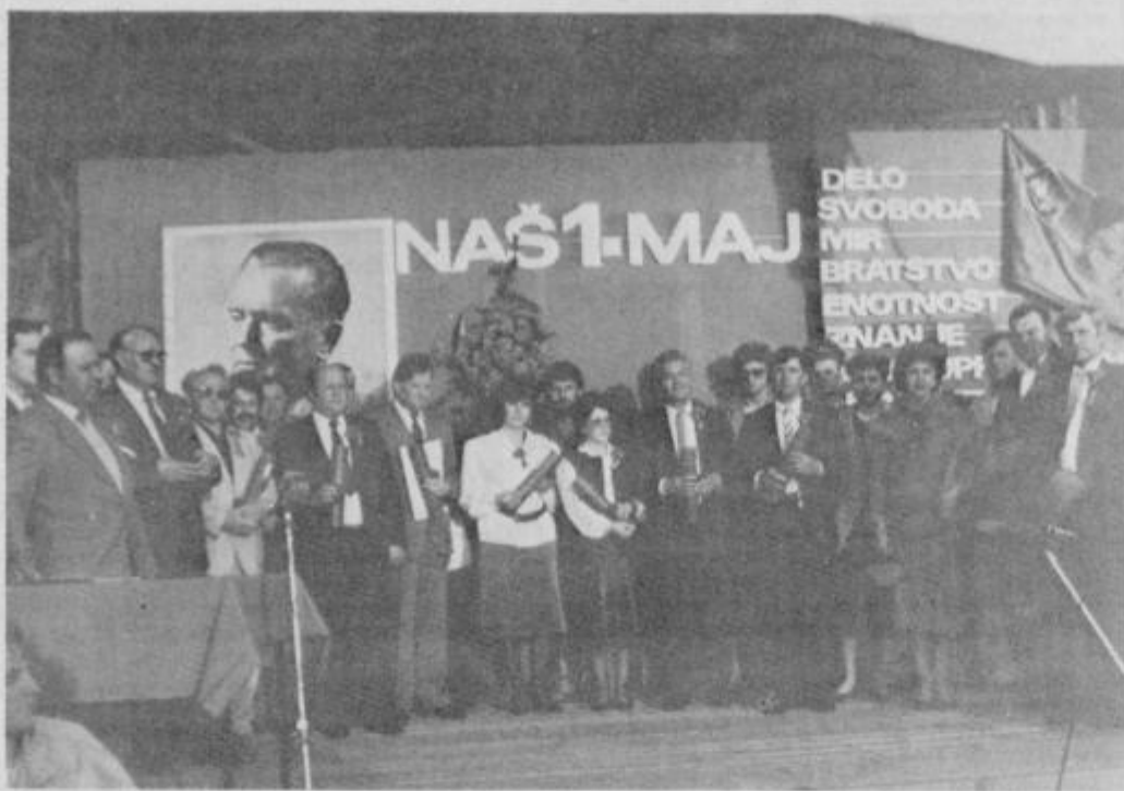
Skupni posnetek letošnjih dobitnikov srebrnega znaka Zveze sindikatov Slovenije.

Zasluznim osnovnim sindikal- nim organizacijam in sindikal- nim delavcem so podelili dvajset srebrnih znakov ZSS in pri tem upoštevali predvsem tiste kandi- date, ki so v daljšem obdobju ne- prekinjeno dosegali nadpovpre- čne rezultate in uspehe pri ure- ničevanju interesov in samou- pravnih pravic delavcev. Ta priznanja so letos prejeli: OO ZSS TOZD Vzdrževanje v TGA Ki- dričevo, OO ZSS Železniške pos- taje Ptuj, OO ZSS obrtnih de- lavcev na področju samostojne-