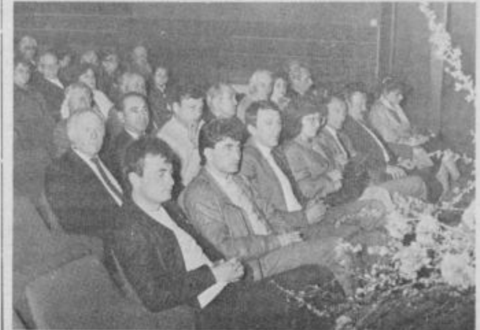
Udeleženci slovesnosti ob dnevu OF