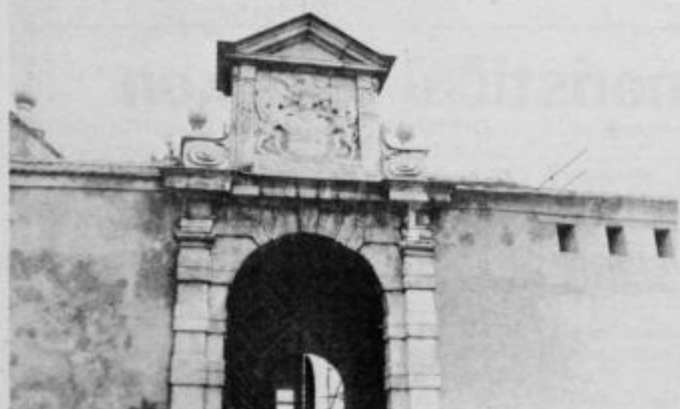
Spodnje grajsko dvorišče