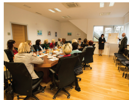
Predstavitve v sejni sobi občinske stavbe

Ob obisku smo si ogledale še občinsko stavbo in nov sodoben vrtec, ki je bil predan namenu v letu 2015.