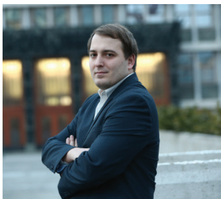
Poslanec Državnega zbora

Zadnje čase si v luči migrantske krize vse bolj postavljam vprašanje, kdaj bo naša politika končno začela delati za slovenski narod. Ko spremljam razprave in aktivnosti Vlade Mira Cerarja, dobim občutek, da za ilegalne migrante ni noben problem zagotoviti zastoj prevozov, zdravstvenih storitev, finančnega nadomestila in drugih bremen, za naše državljanke in državljane pa ni sredstev za dostojno življenje. Migrantska kriza je do zdaj močno obremenila državni proračun, to smo plačali prav vsi državljani in prav bi bilo, da bi politika končno kaj storila za Slovenke in Slovence, ne pa da se zdaj prioriteta celo tuji državljani oz. ilegalni migrantje!