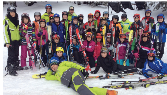
Uživali smo na Kopah