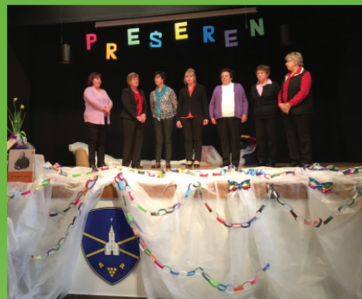
Proslava ob dnevu kulture