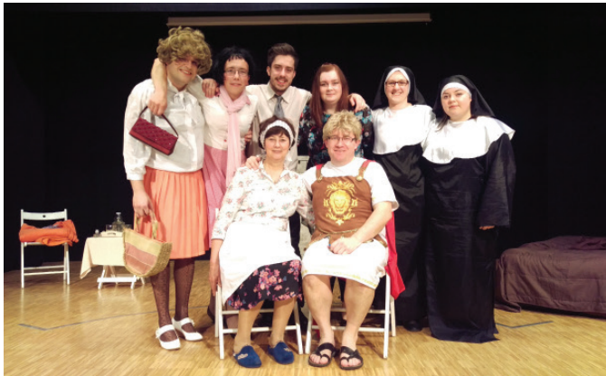
Tudi letos so vitomarški gledališčniki pripravili komedijo

Kot že zadnjih, vsaj 25 let, smo se tudi letos domači vitomarški gledališčniki predstavili z novo predstavo. Znani smo po tem, da se lotevamo le komedij in tudi letos ni bilo nič drugače. Naš grand hotel smo odprli v nedeljo, 6. marca v prisotnosti veliko ljubiteljev gledališča.