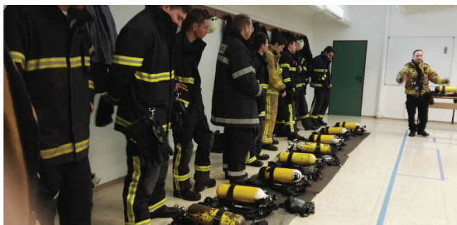
Gasilci na usposabljanju