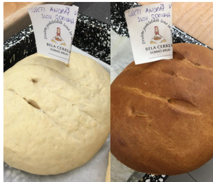
Vsaka županja spekla svoj kolač kruha

grozdja in priprave dobrega vina je v Hiši žive dediščine na voljo sodobno opremljen enološki laboratorij, za izvajanje meritev, pa tudi izvedbo degustacij. V hiši smo se seznanile tudi s kulinariko območja v Sobi žive dediščine, kje se v veliki sodobni kuhinji s krušno pečjo tedensko izvajajo raznorazne delavnice, peke kruha, priprave potic in ostalih dobrot območja. Županje smo se udeležile delavnice peke kruha in spekle vsaka svoj kruh. V daljno preteklost nas je popeljala soba Dežela arheologije. V njej smo se sprehodile skozi obdobje prazgodovine, antike, preseljevanja narodov in preko razstavljenih replik, najdenih na širšem območju Vinjega vrha, spoznate način življenja prebivalcev vse od 8. stoletja pr.n.š.