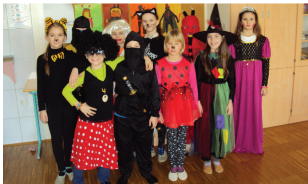
Mi kot pustne šeme, 4. b