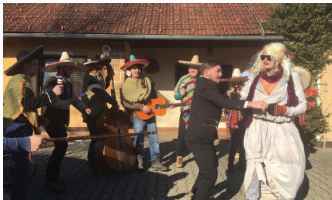
Mariači in mladoporčenca