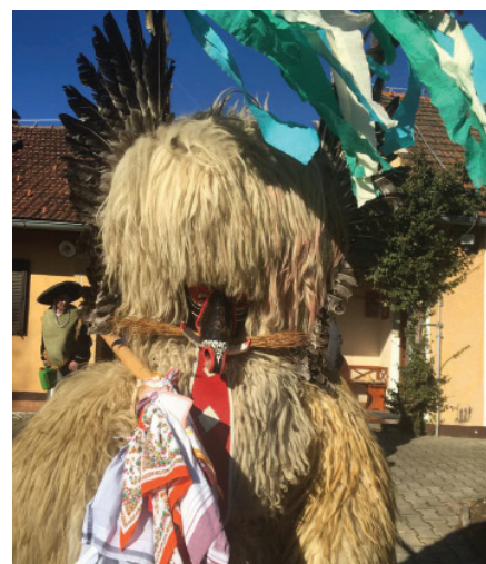
Brez kurenta ni prave povorke

Povorka je potekala v izvedbi večih društev. Turistično društvo Vitomarci je bilo sicer glavni pobudnik, vendar nam brez članov Prostovoljno gasilskega društva Vitomarci in Društva mladih Vitomarci vsekakor ne bi uspelo. Za to se jim zahvaljujemo in upamo na še širše sodelovanje v času pusta. Drugo leto načrtujemo drugačno zgodbo, v kateri upamo, da