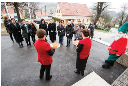
Sprejem v Hišo žive dediščine

Ob enodnevnem obisku smo se večino časa zadržale v Hiši žive dediščine, ki stoji na mestu stare osnovne šole Bela Cerkev in je še kako živa, saj ne mine dan, ko se v njej ne bi odvijale raznorazne prireditve. Z nepovratnimi evropskimi sredstvi Ministrstva za kulturo je objekt nastal v letu 2015, nosilec projekta je bila Občina Šmarješke Toplice, v sodelovanju z Narodnim muzejem Slovenije, Dolenjskim muzejem ter turističnimi ponudniki iz območja Šmarjeških Toplic.