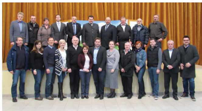
Predstavniki, ki sodelujejo v strategiji razvoja

Na temo priprave strategije so tudi v naši občini potekale delavnice, zato se zahvaljujemo za vaš prispevek pri nastajanju skupne vizije razvoja podeželskega in urbanega dela našega območja Slovenskih goric za obdobje 2014-2020.