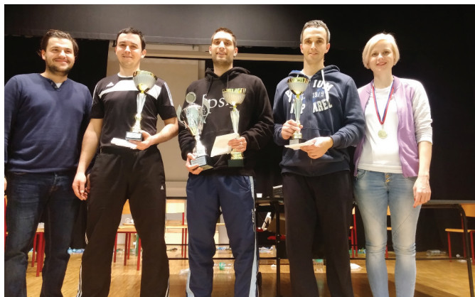
Prva tri mesta v moški konkurenci

Na turnirju so se pomerili domačini, ki so že nekoč krojili sam vrh tovrstnih turnirjev pri nas. Izkazali so se tudi mladi, ki so premagovali velike ase. Obiskali so nas tudi profesionalci, saj so bili prvouvrščeni člani slovenske lige.