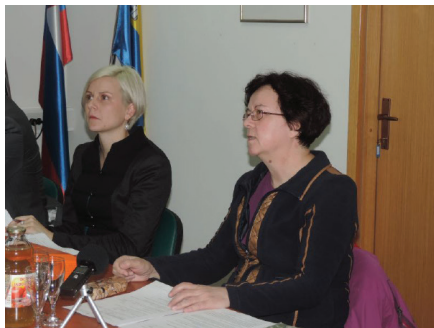
Kopačeva je govorila o upravljenosti vodnih vrtin

13. redna seja Občinskega sveta Občine Sv. Andraž v Slov. goricah je potekala dne 25. 2. 2016 ob 18:00 uri