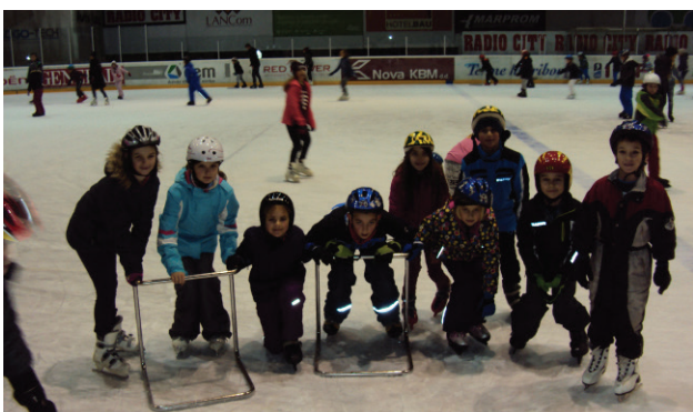
Uživanje na drsanju, 4. b