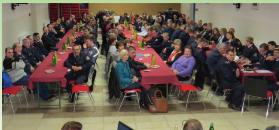
Občni zbor OO Rdeči križ in PGD Vitomarci