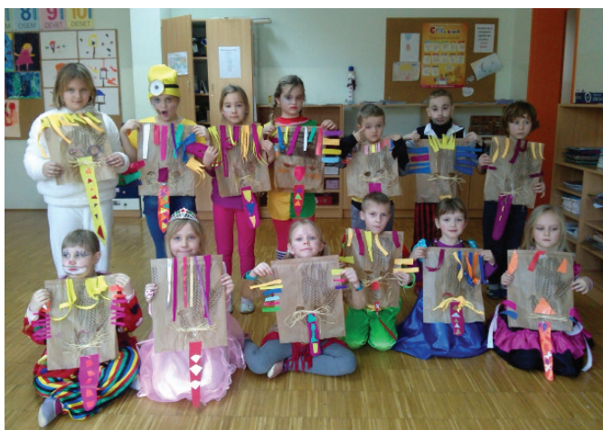
Naredili smo si maske