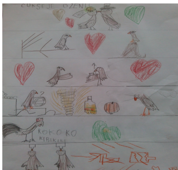
Slikopis pesmi Čuk se je oženil, Zala Anželj, 1. b