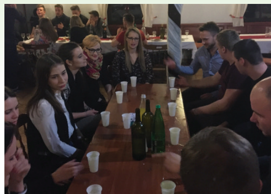
Občni zbor Društva gospodinj Vitomarci in Društva mladih Vitomarci