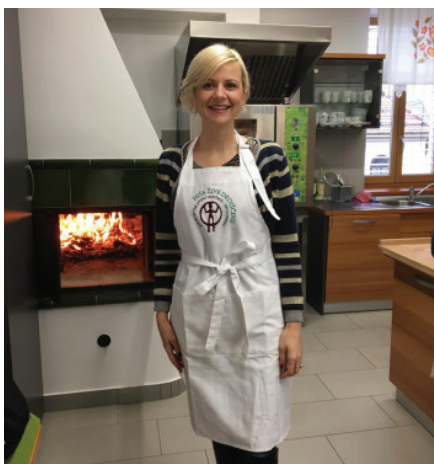
V sodobni kuhinji in krušni peči so nastajale naše stvaritve