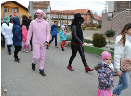
Pustna povorka, ki je krenila od cerkve do Večnamenske dvorane

Kvartetu Društva upokojencev, kateri je prvič nastopil na naši kulturni prireditvi in naši občini za finančno podporo pri pogostitvi. Veseli smo bili vseh ljudi dobre volje, ki ste se udeležili naše povorke, bodisi v zanimivih in zabavnih maskah, bodisi kot gledalci. Vzdušje je bilo pravo - radostno, zato se bomo v tej smeri potrudili tudi naslednje leto, ko bomo, tako načrtujemo, pripravili pustno povorko in rajanje za otroke in starše v maskah.