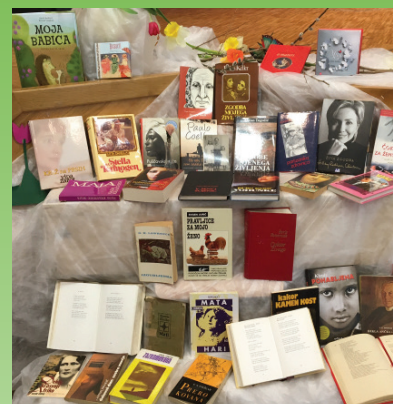
Proslava ob dnevu žena