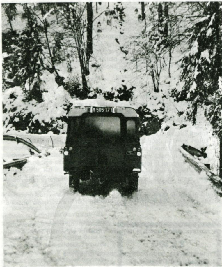
Zaradi neurejenosti je cestni odsek od Rovt proti Žirem predvsem pozimi težko prevozen. Promet je najbolj oviran na mostovih.

Skupščina občine Logatec in Skupnost za ceste občine Logatec sta skupnosti za ceste SR Slovenije dali tudi pismeno zagotovilo o pripravljenosti obeh občin in združenega dela, da zagotovijo del sredstev za rekonstrukcijo naštetih odsekov. Organi skupščine občine in skupnost za ceste bodo proučili še osnutke urejanja cest v letu 1988 in vztrajali, da se naštete odseke uredi v letošnjem letu.