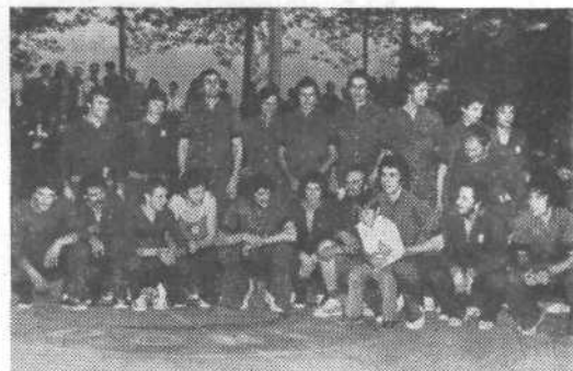
Ekipi Olimpije in Medvod

Košarkarski delavci TVD »Partizan« Medvode so konec maja slovesno proslavili 25-letnico igranja te priljubljene športne panoge v kraju. Najprej so se zbrali na slovesni seji, kateri so prisostvovali številni košarkarski in družbenopolitični delavci, sledila pa je otvoritvena tekma praznovanja, kjer sta se pomerili članski vrsti Medvod in ljubljanske