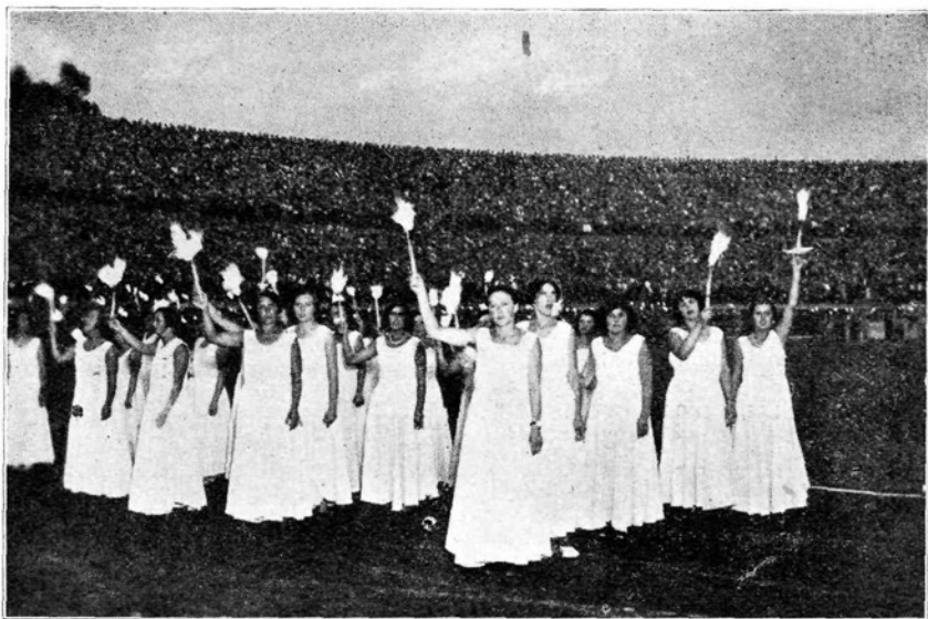
Scena iz igre na stadionu

V petek 24. julija so se na raznih igriščih nadaljevale olimpijske tekme. Popoldne je dunajski župan Seitz sprejel vodstva vseh delegacij. V svojem govoru je poudaril predvsem to, da je v Avstriji enotno delavsko gibanje in da le radi te enotnosti delavci upravljajo Dunaj. Ob šestih zvečer je bila zanimiva plavalna tekma po donavskem kanalu skozi Dunaj. Udeležilo se je je 20 držav, zmagal je Dunajčan Wimmer.