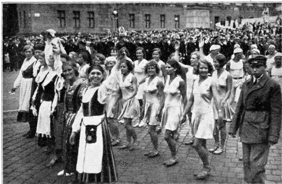
Finske sportašice v sprevedu