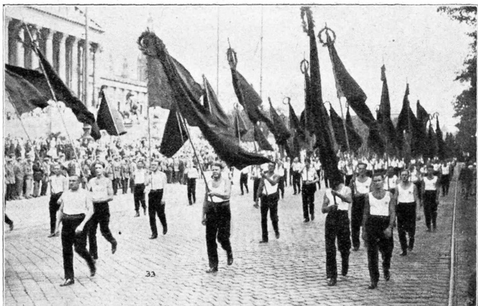
Zastave v sprevedu