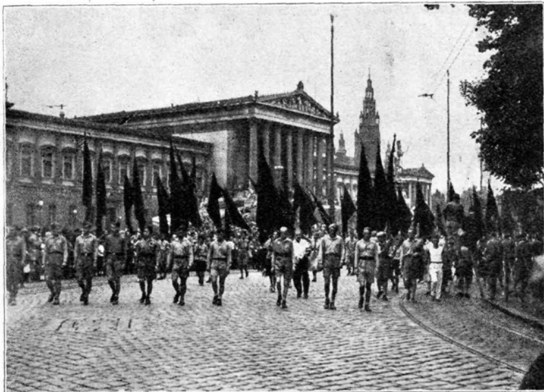
Slika z otroškega sprevoda ob priliki dunajske olimpijade

Ta politični kabaret si je ustanovila soc. igralska skupina v I. okraju. Igrajo delavci, nameščenci in študentje. V tem političnem kabaretu vidiš ves političen razvoj in do srca se nasmeješ. Kabaret se je že tako prikupil, da na cesti slišiš