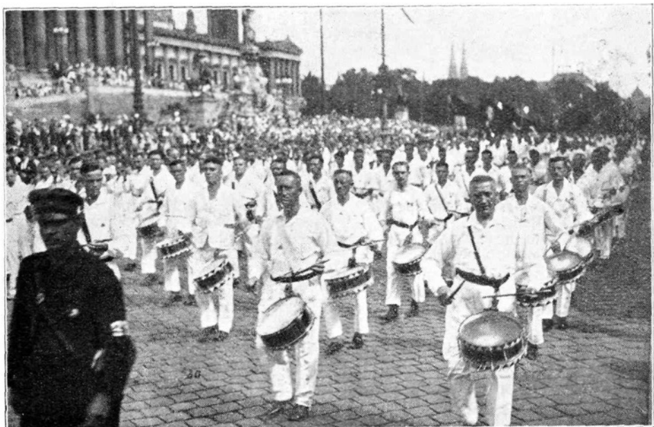
Iz sprevoda na dunajski olimpijadi