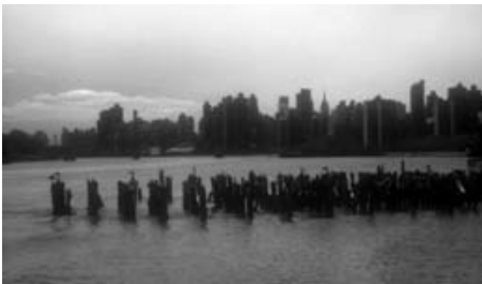
VODNI TOK: MIRNA VODA, SLEDI REKE estetska / uporabna vrednost (New York)