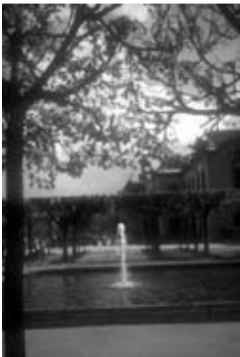
VODNI IZVIR estetska / praktična vrednost (Dresden)