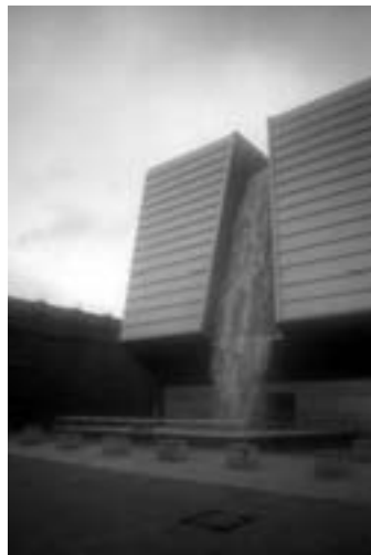
VODNI TOK: VODNA ZAVESA estetska vrednost (Hanover)