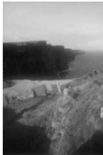
STOJEČA VODA: MORJE neposredni stik / posredni stik (Irska)