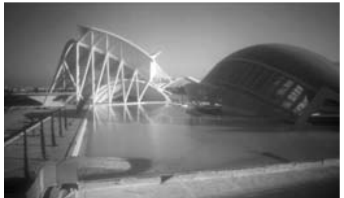
STOJEČA VODA: (umetno) jezero, odsevi (Valencia)