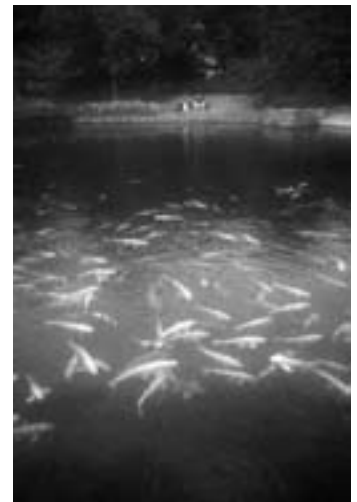
STOJEČA VODA; JEZERO neposredni stik z vodo (Nagoya)