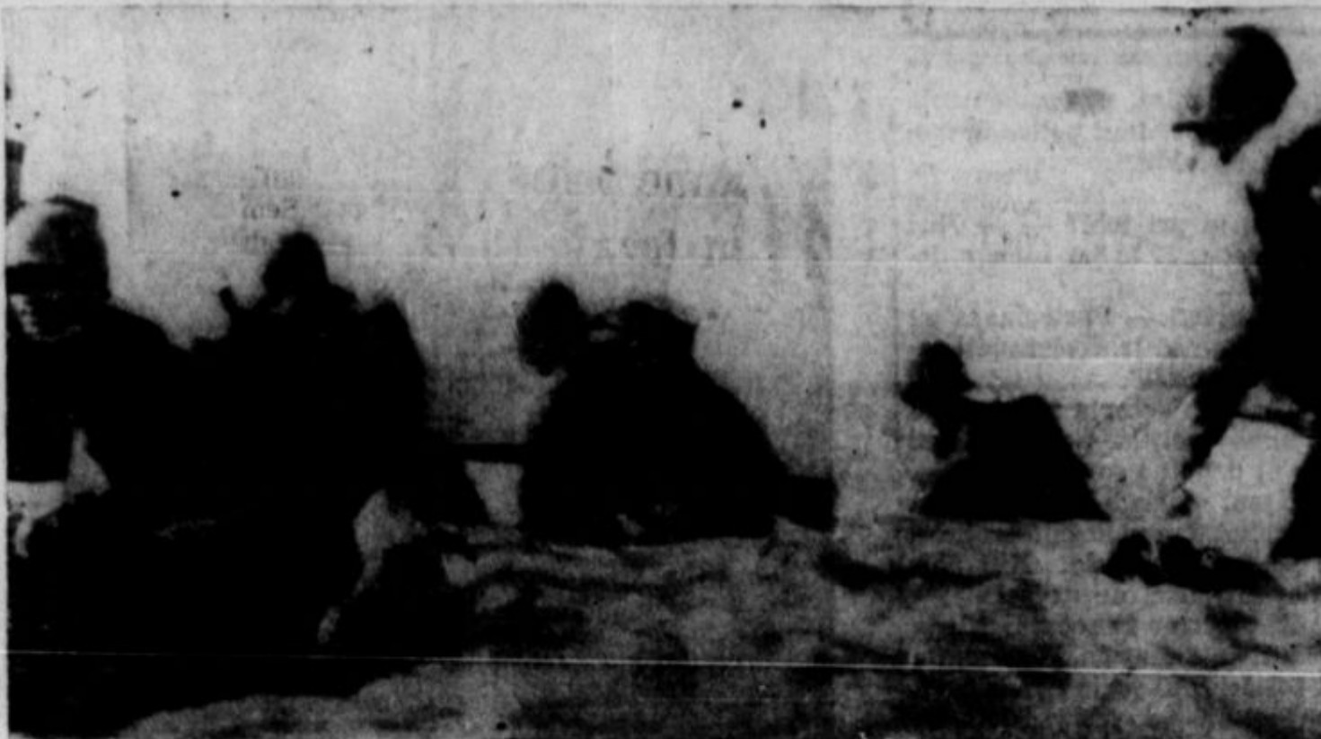
AMERISKA MORNARIČNA PEHOTA (marines) prodirajo do pasu v vodi blizu otoka Engebi, da prečenejo z njega japonske topniške posadke.

"Hrvatski Svijet" v New Yorku se pritožuje o eni zelo nesrečni, nepotrebnih polemiki, ki je nastala po poročilu radia "Svobodna Jugoslavija", da znaten