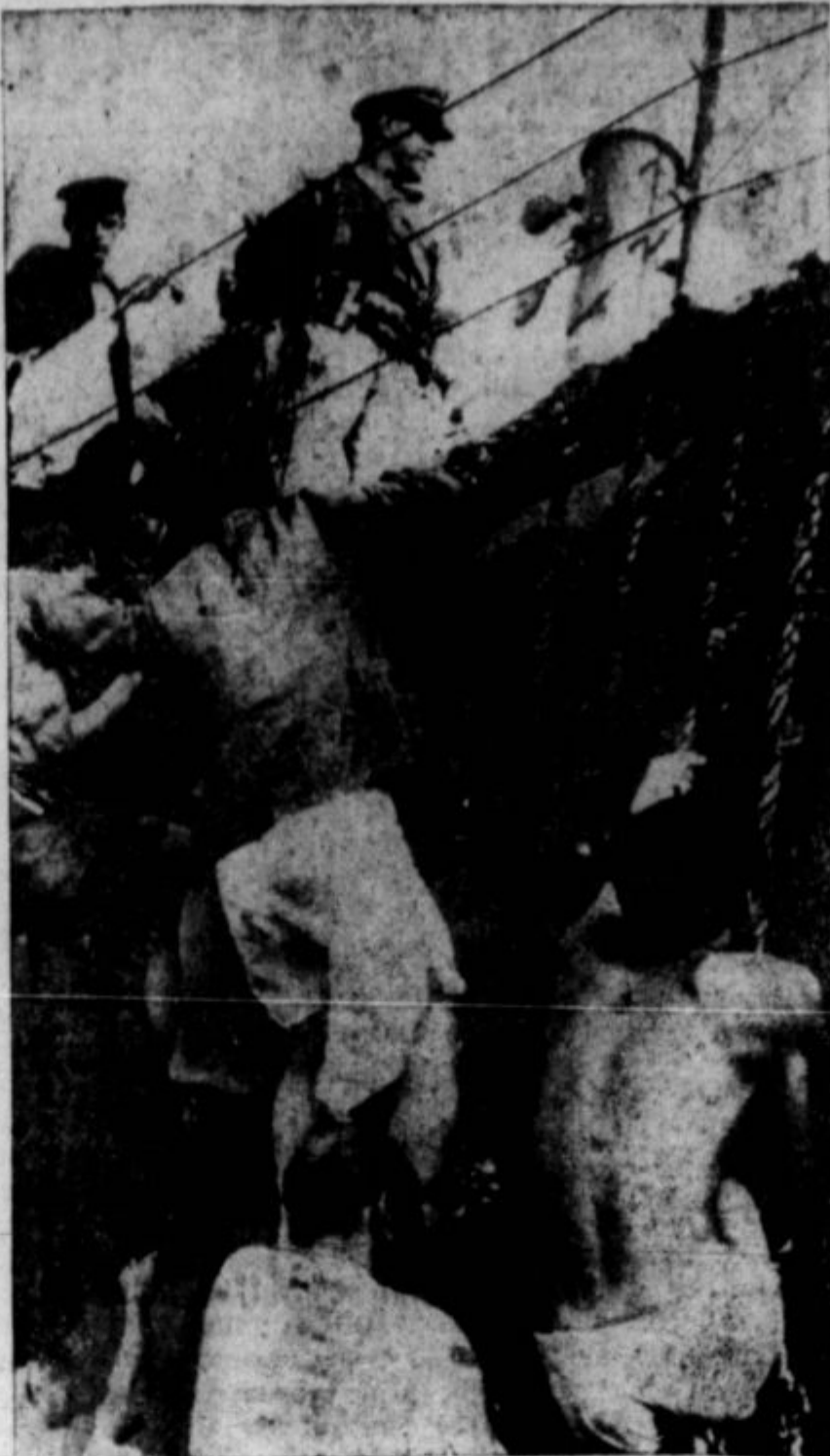
TUDI JAPONCI radi žive, čeprav o njih v sedanji vojni pripovedujejo, da rajše poginejo kot da se bi dali žive izročiti sovražniku. Gornja slika jih predstavlja, ko se blizu Maršalskih otokov na Pacifiku rešujejo na ameriško transportno ladjo.