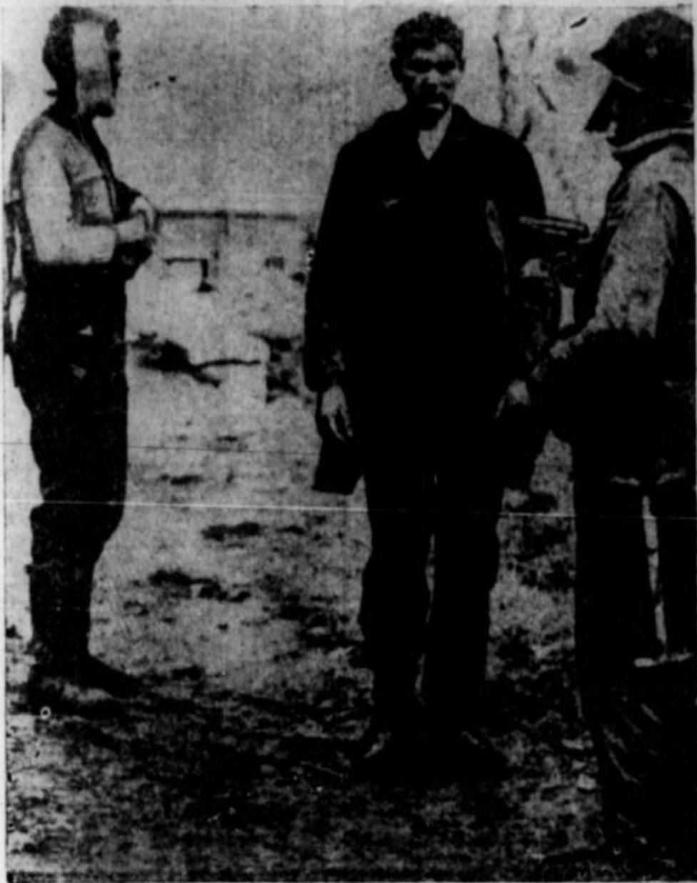
NEMSKI VOJAK, ki ne bo več streljal iz zasede. Bil je vjet, kot pove gornja slika, in na rokavu je imel trak Rdečega križa. Zalotili so ga v tej zavrtnosti blizu Acciarelle v južni Italiji.