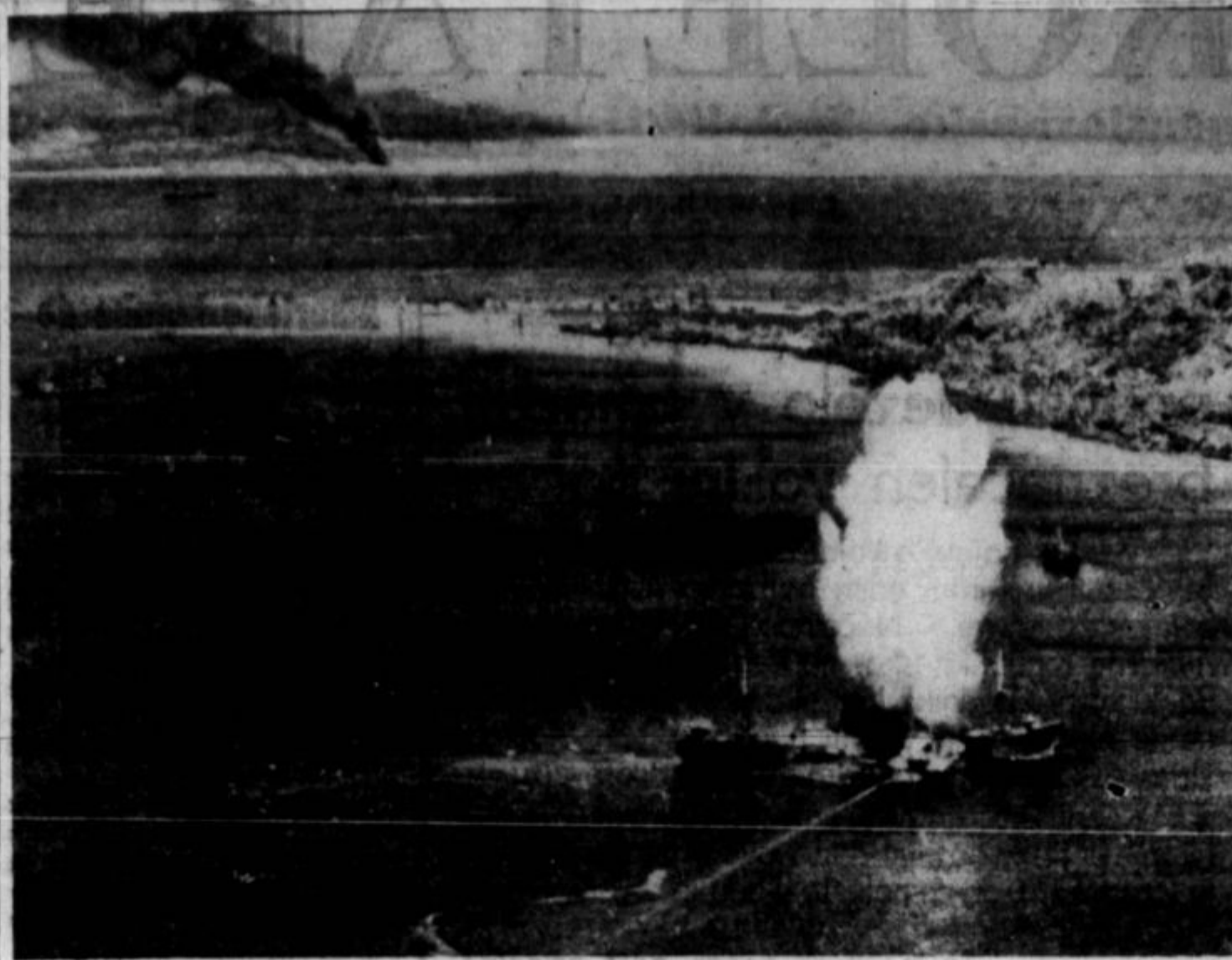
JAPONSKI RUSILEC, ki so ga ameriški letalci potopili blizu Truka na Pacifiku.

To se je zgodilo. In čeprav je Moskva lani oznanila, da je kominternu razpustila, vidimo v Italiji, v Angliji in v Zed. državah, da se zelo dobro deluje, namreč dobro po tokih vnanje politike sovjetske vlade in s tem v interesu Rusije. Anglija in Zed. države