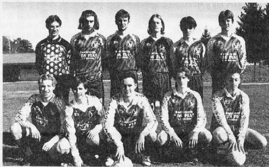
Gli Juniores della Valnatisone che hanno affrontato di recente la Torreanese