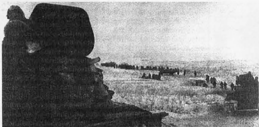
Contrattacco di carri armati sovietici dalle teste di ponte sul Don (autunno 1942)

Le esplosioni osservate dagli alpini dalle loro postazioni non sono che un aspetto della prima fase della operazione Saturno: i cinquemila cannoni di Vatutin devono "arare il terreno", sbriciolare i campi minati, i rifugi e i cammina-