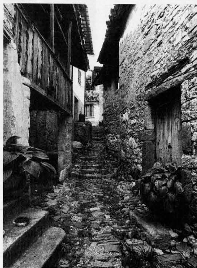
Motiv iz Topolovega

Kaj je paršlo uon? Parvič, de je Dežela Furlanija Juljska krajina v italijanskem merilu na parvih mestih glede tele krize. An v naši deželi, od vsieh 219