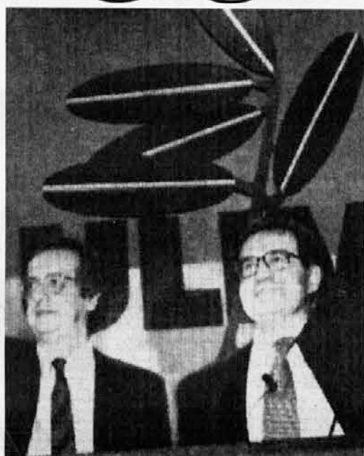
Veltroni e Prodi, i due leader dell'Ulivo

Speriamo che la gente ragioni su questi argomenti e non cada nella trappola delle facili promesse. Tutti ricordano il milione di posti di lavoro, svaniti subito do-