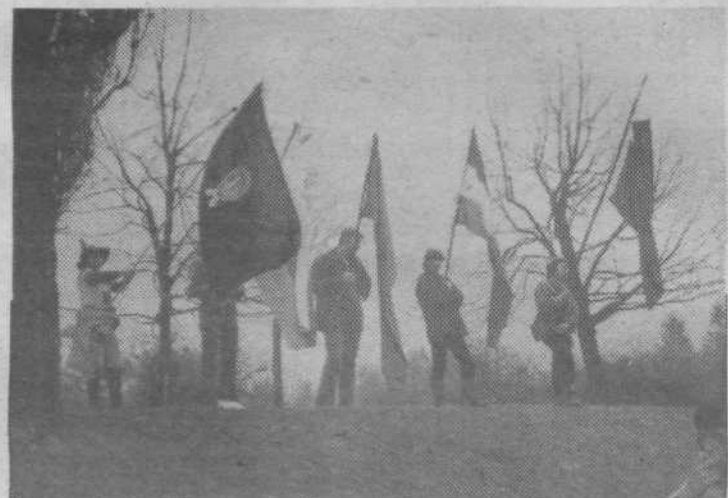
Pred odhodom z Urha