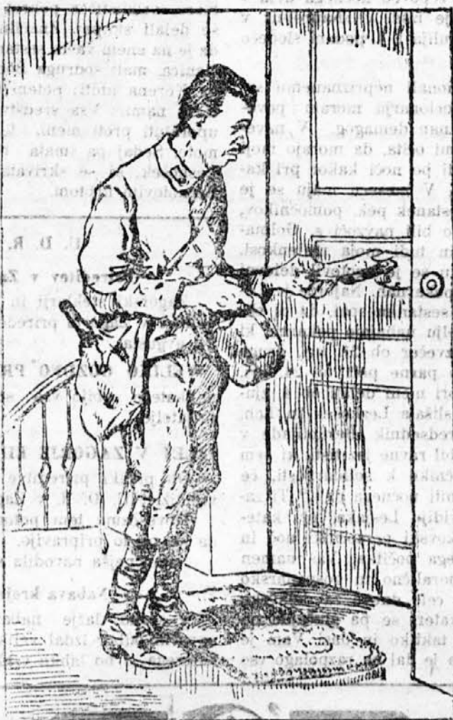
Burzuzija konsolidira, delavec pa berači!

kulacija najhujše orgije, ker so vladne mere proti njej tako slabe, da se vobče niti ne upoštevajo. Kaj tedaj storiti? — Čakati in čakati? Ne! Treba poseči po samopomoči, to se pravi poprijeli se svojih zadrug, stopiti vanje, pri njih na-