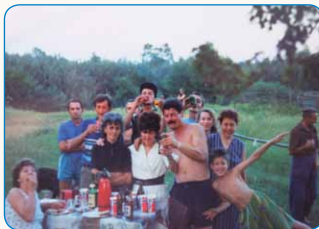
MALI GA JE NEJ SPOZNO stran 8