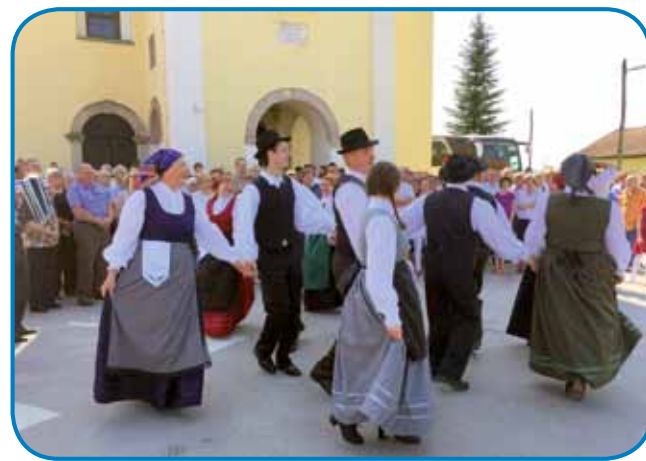
Folklorna skupina pleše štajerske plese ino je edna sekcija kulturno-umetniškoga društva

Napis nad glavnimi dverami cerkve kaže na gorečo lübezen, vöro ino zavüpanje lüstva v