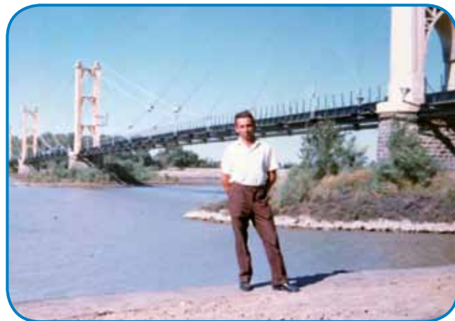
Mauž Pišti je delo v Siriji pa v Ageriji tō

- V gledališki skupini še gnesden špilam, tak si dosta-krat zmišlavam, ka bi tak mogla njati, zato ka sem že stara za tau. Pa če bi še tau nej dojšlo, te še v crkvenom zbori tō popejvam, dapa ka aj delam,