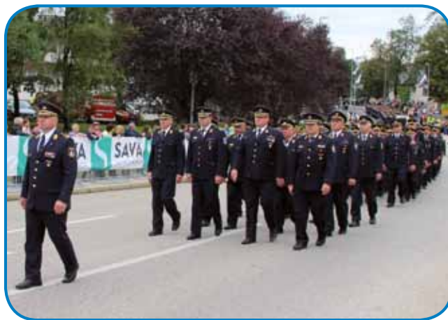
V čest njemi je bilou, ka je na paradi v Metliki vodo ešalon pomurskih gasilcov

paut izvolili za regijskoga gasilskoga poveljnika. Zdaj mi teče že tretji mandat. V veliko čest mi je, ka mi lidge zavūpajo, vej pa znamo ka je gnesden nej tak na leko z lüstvom delati. Sam tüdi član poveljstva Gasilske zveze Slovenije, v Črenšovcaj pa sam zdaj predsednik gasil-