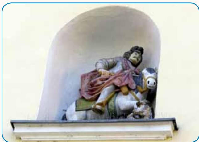
MARTINOVNO LÜSTVO V ROŽNOM DAULI stran 3

»NE DOJDE, KA SE RODIŠ ZA SLOVENCA, ZA TAU SE MORAŠ TRÜDITI ...«