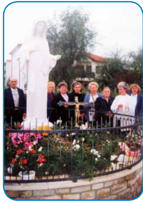
Na prauški v Medjugorji

»V dosta mejstaj sem odla, gnauk sé, gnauk ta demo, na ednom kejpī, ka je pred nama, smo paulak Pešte, v Mariaremeti bili. Na drūgom kejpī, gde smo dolavzeti, smo pa v Medjugorji bili. Dja ne vejm, kak je tau, dočas ka je človek delat odo, bola vse čas emo sé pa ta odti, pa ranč tak