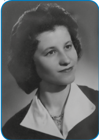
Montiska Irinka v mladi lejtaj

»Mi, ka smo vekši bili, mi smo male mlajše mogli skrb meti, pri nas je tak rejdko bilau, ka bi se cejli den leko špilali, zato ka pri nas je sir trbelo nika