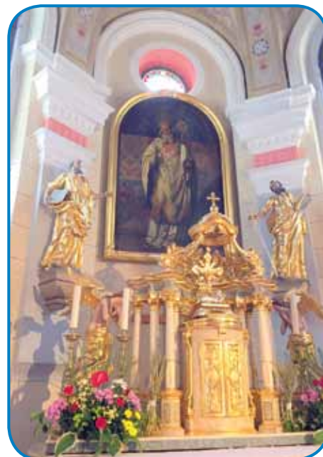
Kejp o patronuši, svetom Martini, je cerkvi podaro blajženi püšpek Slomšek

12 vesnic ali zaselkov, tü živé kauli 1300 vörnükov. Vörski žitek je lejpi, dosta lüstva pride k nedelskim mešam. Pri veronavuki mamu kauli stau decé, mlajši pa mladi tö radi odijo