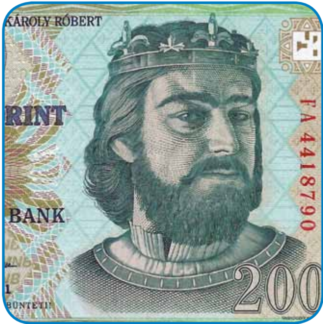
Vözmišleni portret Karola Roberta na stari 200 forintaj

grskom vökopali skoro polonje, od srebra pa dobro frtau. Karol je dau kovati zlate penenze z imenom »forint« pa srebrne »dénare«, šteri so držali svojo vrejdnost. V njegovom cajti so našli vnaugo soli v krajini Máramaros (na Erdeljskom),