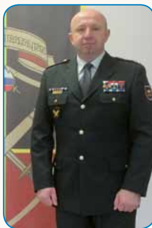
»VELKO ČEST MI JE, ...« stran 4