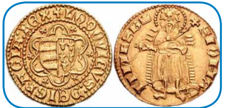
Krau Lajoš I. Veliki je ranč tak dau kovati »zlate forinte«

Če rejsan se je Lajoš dosta na tihinskom zdržavo, je biu med njegovim kralüvanjom réd ino mér v rosagi. Leta 1351 je vküppauzvo državni djilejš, na šterom je potrdó skoro vsa rendelüvanja »Zlate bule« z leta 1222. Od tistoga mau so bili nemešnjaki praktično eden stan (rend), šteri je svoje grünte nej smo odati ali podariti. Če je plemenita rodbina