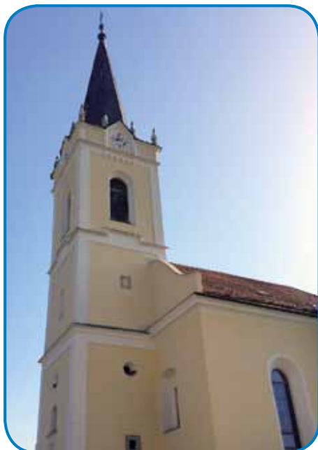
Originalno so törem cerkve zozidali leta 1606, za en štauk pa so ga povekšali leta 1884

11. novembra smo svetili den svetoga Martina, ednoga najbolje prilüblenoga patronuša v Evropi. Kak vejmo, se je té svetnik naraudo v rimskoj Savarii (gnešnjom Sombotelii), zatok je patronuš naše sombotelske püšpekije tö. Dobro ga poznamo po tom, ka je pred dverami galijskoga varaša Amiens svoj köpenek talo z ednim kaudišom, šteri se ma je kisnej v senjaj pokazo kak sam Jezoš Kristoš. Sploj erične so njegve gosi, štere so ga vöovadile, gda se je v Toursi skriu, vej je pa nej sto püšpek biti. Kauli dneva svetoga Martina zatok