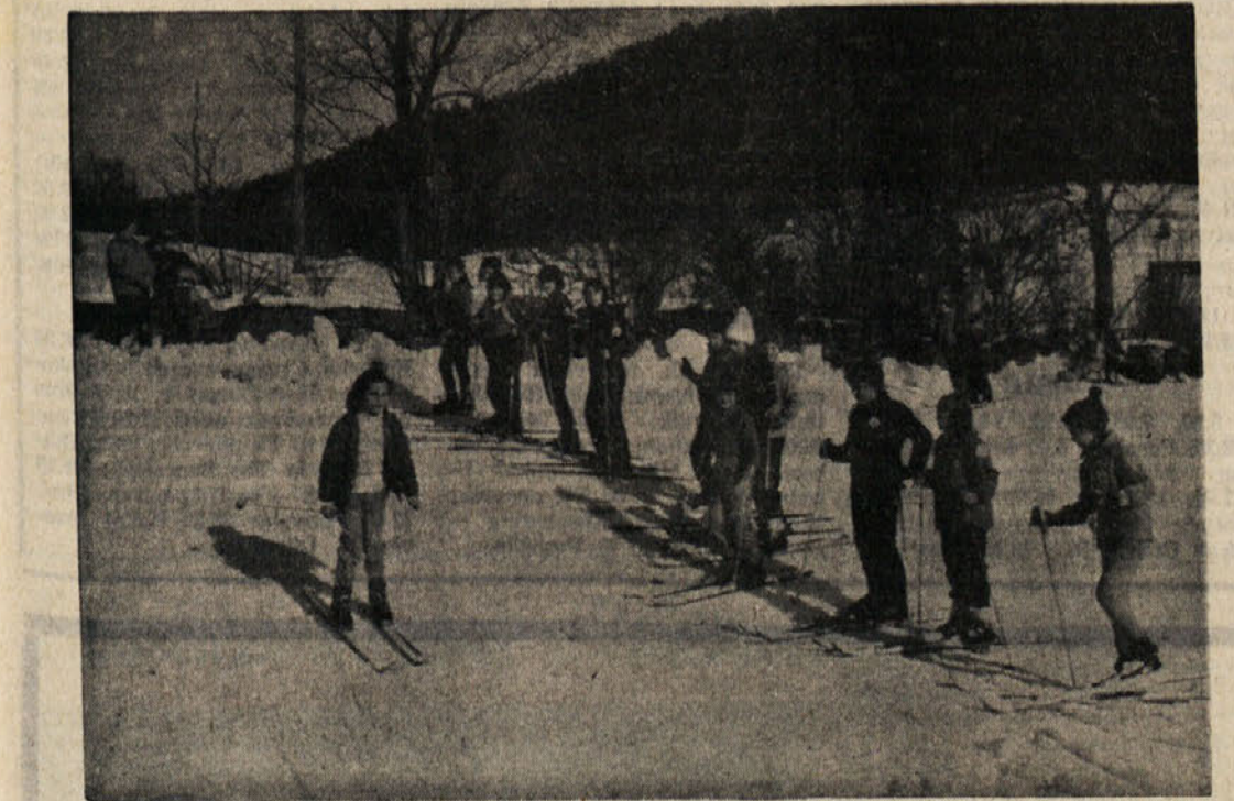
Slovensko planinsko društvo iz Trsta ima letos s svojimi smučarskimi tečaji zopet rekordno čelnino: na smučarskih holi je vsako nedeljo prvi živčav. Med najbolj prizadevnimi so prav najmlajši