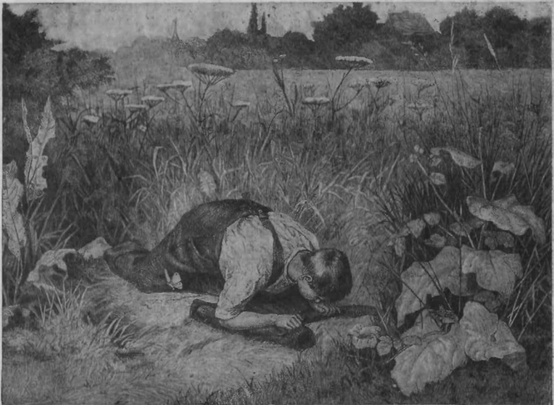
»Ali te imam?«