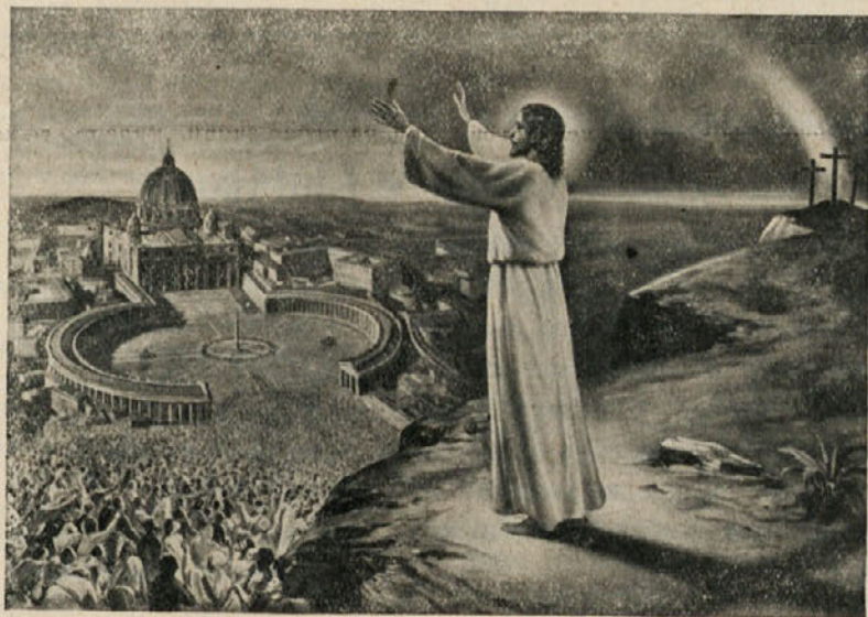
Jezus vabi vernike celega sveta v svojo najsijajnejšo hišo, v baziliko sv. Petra v Rimu.