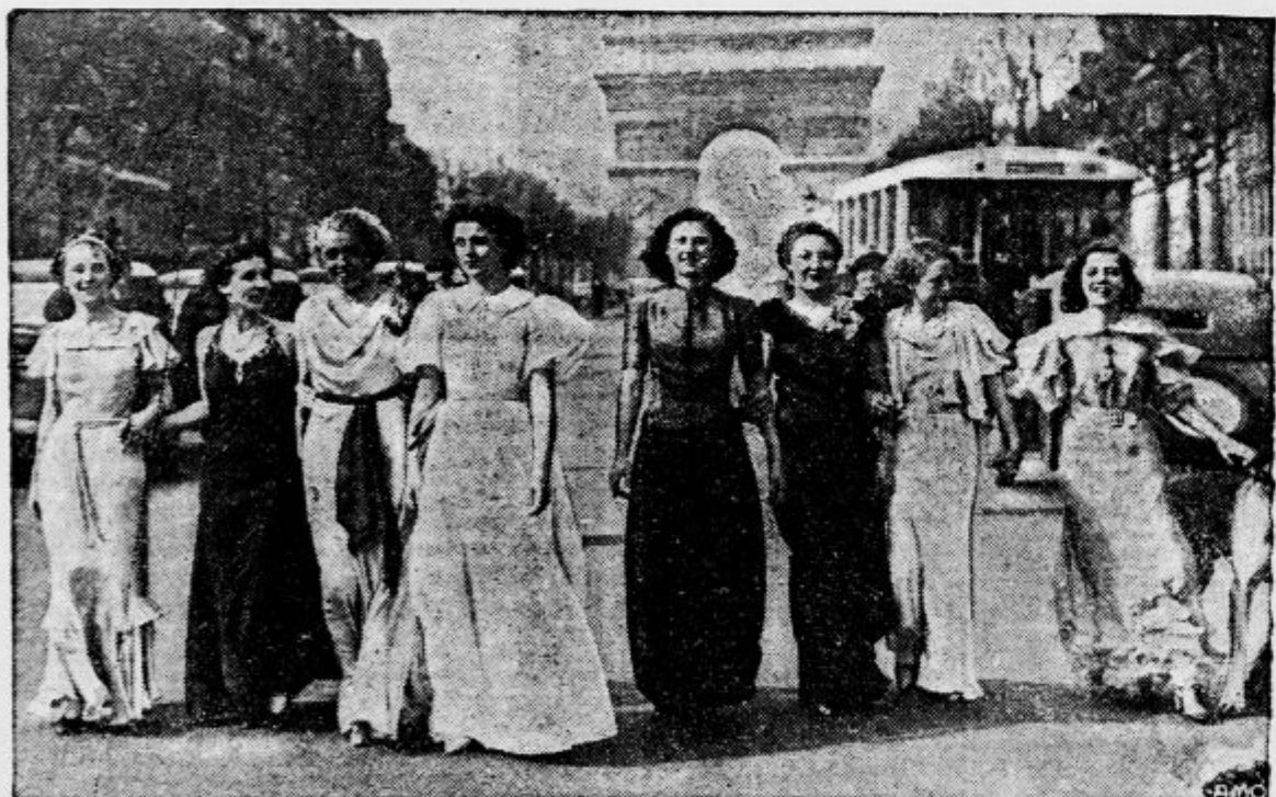
V Parizu pripravljajo izvolitev miss svetovne razstave 1937. V poštev prihaja osem konkurentk, ki jih vidimo na tej sliki