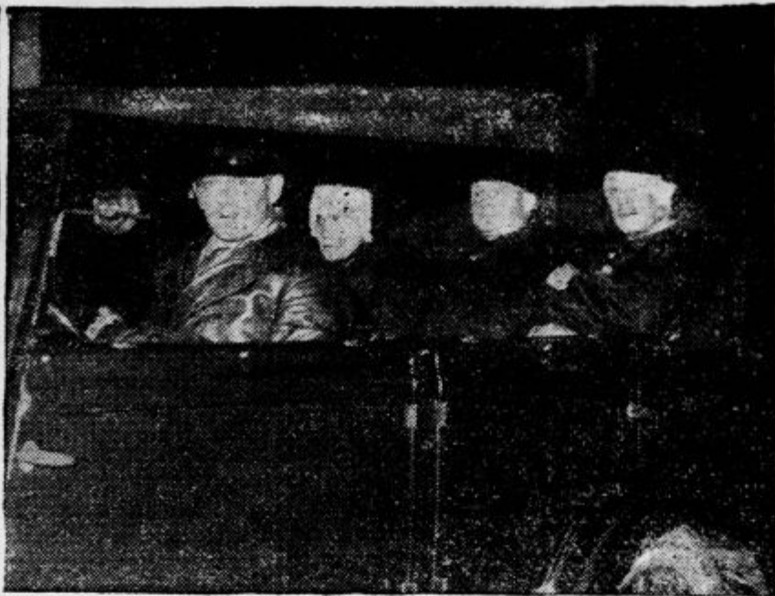
Te dni je prišlo v Parizu do krvavih spopadov med političnimi pristaži »Ognjenega križca« in med levičarsko usmerjenimi elementi. Žrtve teh spopadov so bili stražniki. Na levi: Policisti se skrivajo za avtomobilom, da bi se ubranili krogel iz vrst demonstrantov. Na desni: Ranjene stražnike peljejo z avtobusom v bolnišnico.