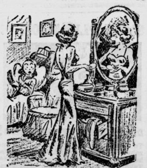
»Zdaj sem že dva meseca tajno zaročena z Jackom, nocoj pa mu bom to povedala...«