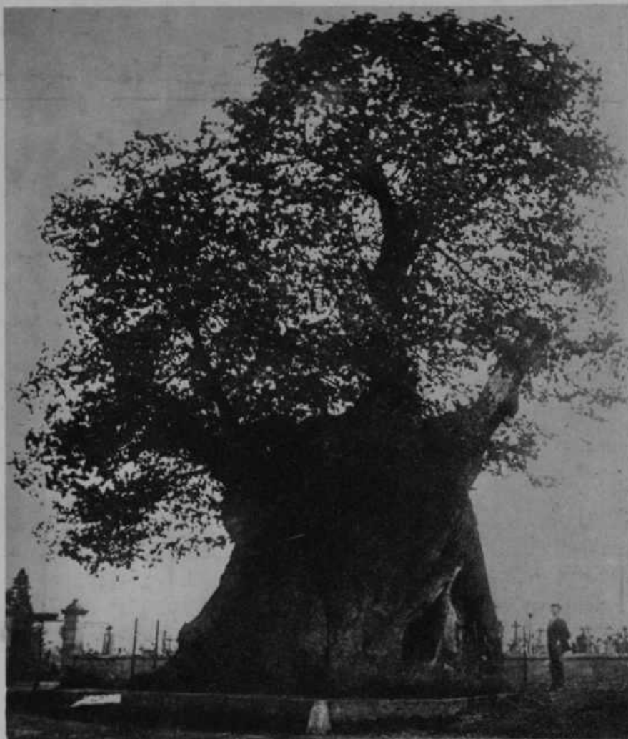
Najstarejša lipa, ki ji prisojajo 1200 let, stoji v Staffelsteinu na Nemškem. Spodaj meri v obsegu 24 m, Zeleni samo še po eni strani, druga stran se je že posušila.