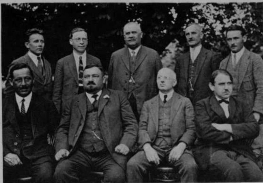
Odbor Društva kmetijskih strokovnjakov za Ljubljansko in Mariborsko oblast (tč. sedež v Mariboru, Vinarska šola).