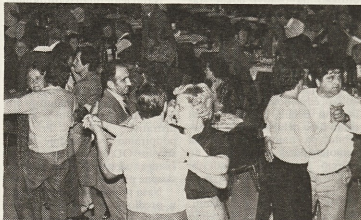
Na vsakoletnih srečanjih upokojenih sodelavcev je vedno živo. Prav radi se zavrtijo ob poskočnih zvokih muzikantov.

Od ponedeljka pa do konca tedna se bodo zvrstila športna tekmovanja. Udeležiti se jih lahko vsaka delavka in delavec Predilnice Litija.