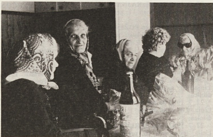
Vsako leto obiščemo ob tovarniškem prazniku naše upokojene delavce, ki bivajo v domu počitka »Tisjek«, v Črnem potoku. Slika prikazuje eno takšnih srečanj s prejšnjih let.