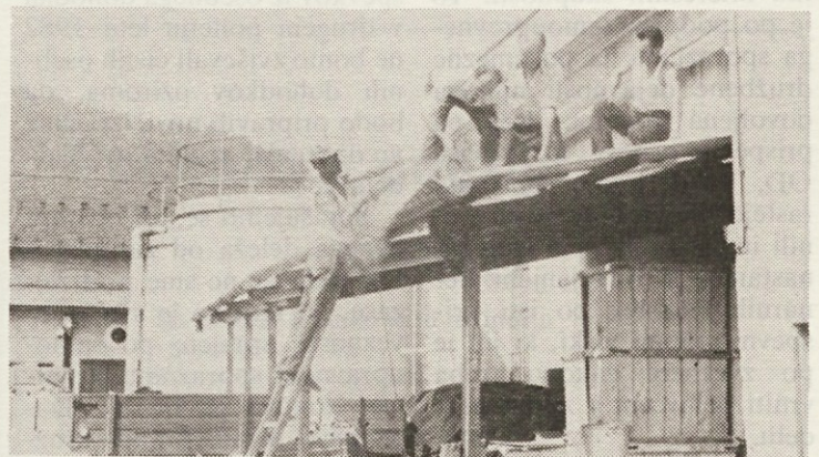
Delavci iz kotlarne so skrajšali kovinski nadstrešek ob efektni sukalnici. Mizarji in delavci zidarske skupine pa so nadstrešku nadeli novo streho.

Tako je odpravljen del ozke transportne poti, ki vodi na dvorišče ob tovarniškem dimniku. Sedaj se bodo verjetno šoferji tovornjakov oddahnili, saj bodo lahko brez posebnih manevrov in strganjih cerad vozili mimo nadstreška.