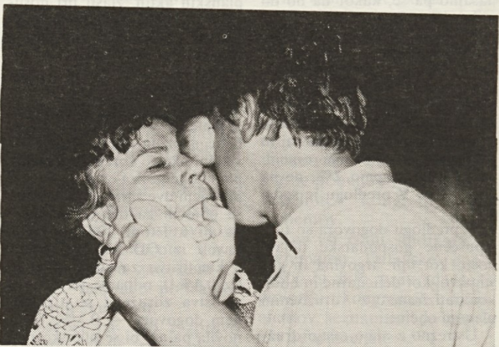
Trenutek šaljivega tekmovanja upokojevcev na lanskoletnem srečanju.