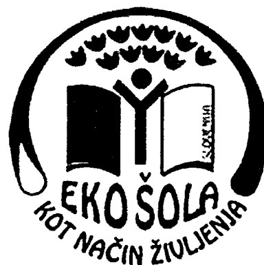
ZNAK SLOVENSKE EKO