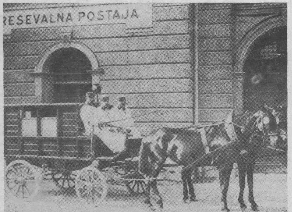
Takle je bil rešilni voz v tistih časih, ko še ni bilo motorizacije