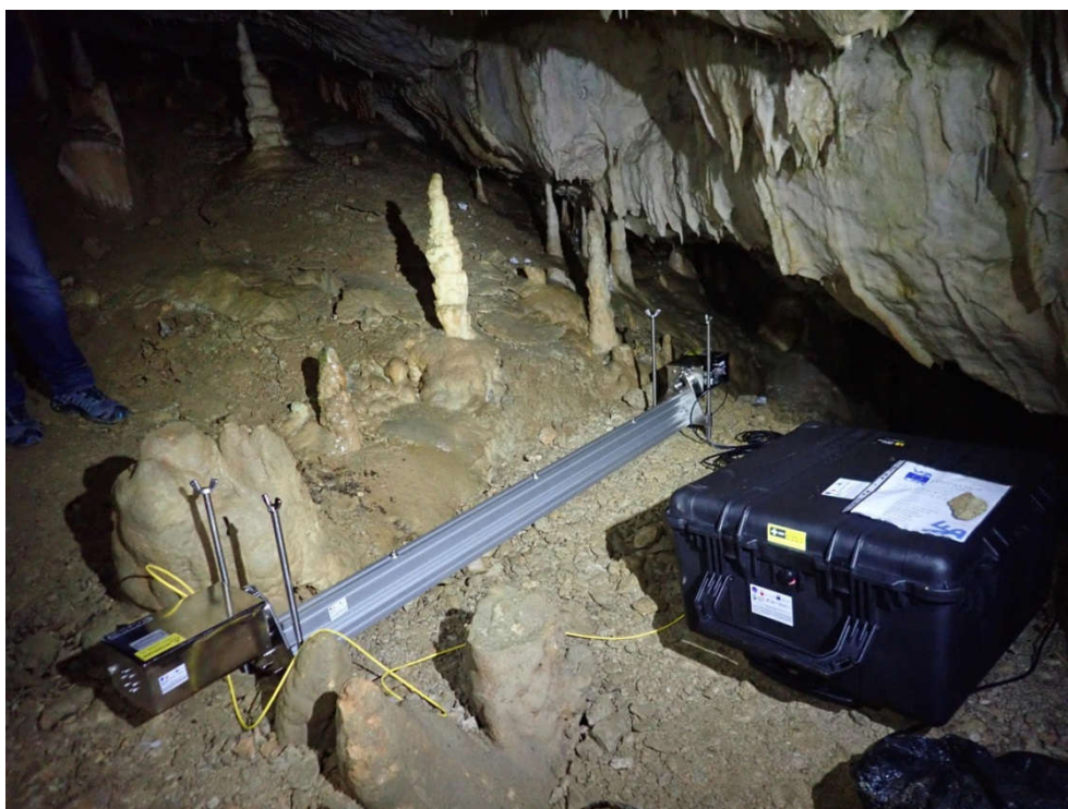
Slika 1 – Laserski diodni spektrometer za merjenje koncentracij metana, Lepe jame, Postojnska jama, foto S. Šebela.

V okviru projekta RI-SI-EPOS smo v letu 2020 pridobili OPSIS LD500 analizator, ki je centralna enota lasersko diodnega sistema za merjenje metana ( https://www.opsis.se/en/Products/Products-CEM-Process/LD500-Laser-Diode-Gas-Analyser ). Spektrometer deluje na principu DOAS (Differential Optical Absorption Spectroscopy) in je od 9.9.2020 nameščen v stranskem rovu Lepih jam v Postojnski jami (Sliki 1 in 2). Poleg koncentracije metana v zraku (v ppb) izvajamo tudi vzporedne meritve koncentracije ogljikovega dioksida (v ppm), temperature zraka in zračnega tlaka. V neposredni bližini se opravlja 3D monitoring mikro-premikov s tenziometrom TM72. Konec septembra 2021 je bil spektrometer kalibriran. Napaka spektrometra znaša 100 ppb.