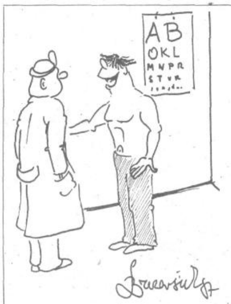
Ampak gospod doktor, kaj naj pijem, ko pa ne smem ne vode, ne kave, ne alkohola...?