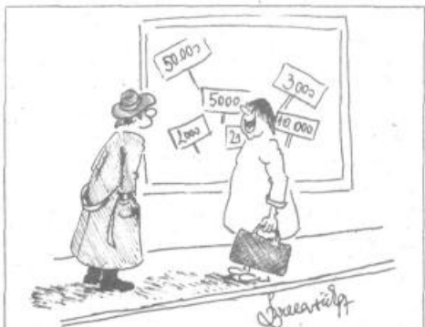
Kdo pa se pritožuje nad skromno maloprodajno mrežo, ko pa bo še ta kmalu prevelika!

Od skupno 98 prodajal jih je 59 z živili in gospodinjstvi potrebnimi, 20 je trgovin z mesom in perutnino, 16 je trgovin s sadjem in zelenjavo (od tega je 12 kioskov) ter tri prodajalne s kruhom.