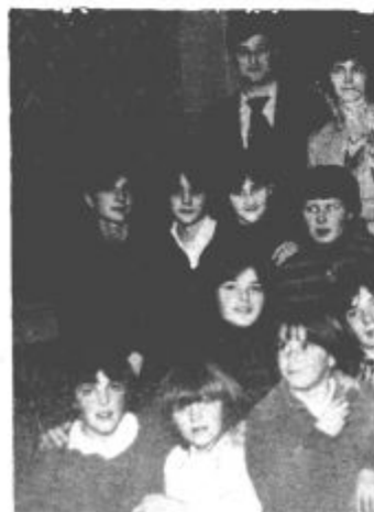
Novo sprejeti člani

Naše gasilsko društvo ima 65 članov. V svoje vrste smo ta dan sprejeli še 20 članov, predvsem mladink. Spomnimo namočevali, da bomo pri gasilskem domu zgradili prizidek in tako lažje ter uspešno opravili naloge, ki so pred nami. Z veliko pomočjo naših krajanov smo ta prizidek dogradili.