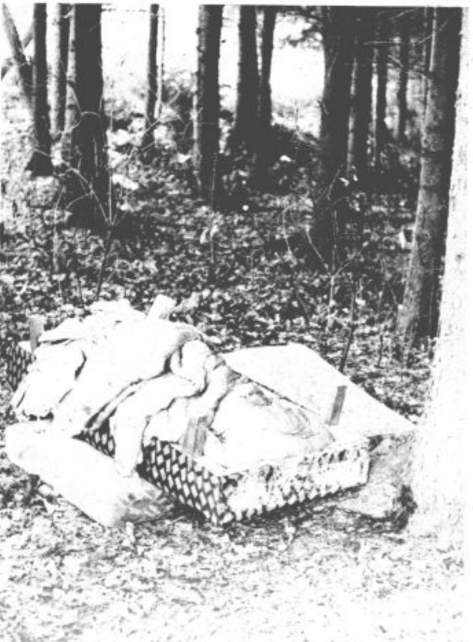
Udobje pod vedrim nebom