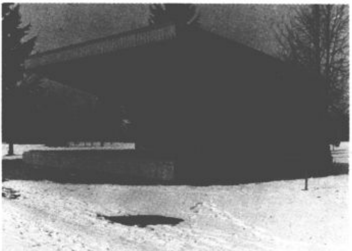
Kdaj ga bodo odstranili?