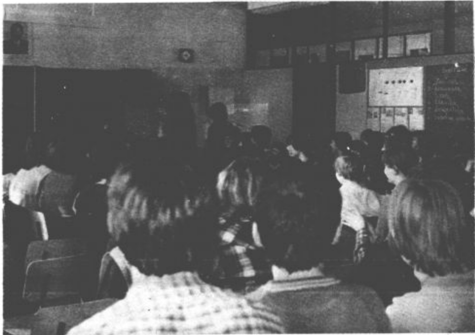
Podelitev značk na osnovni šoli Veljka Vlahovič.