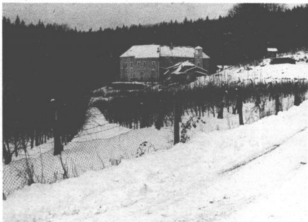
Sodobna cesta proti Turnu bo pomembna pridobitev za krajanje tega področja

Škalčani in Hrastovčani pa imajo nerešenih še mnogo drugih vprašanj. Vsa po vrsti pa so tako pereča, da je potrebno k njihovi razširitvi pristopiti nemudoma. Veliko težav je povzročila iz-