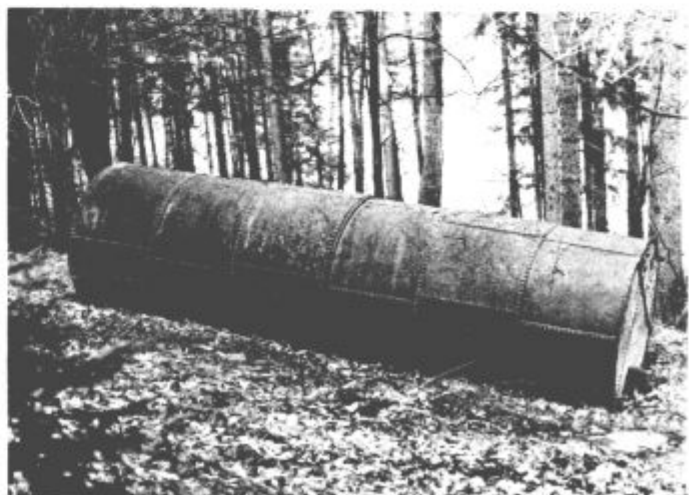
Tudi takšno cisterno je najlaže odvreči v gozd

Na jesen pa jih bo spet več, če ne bomo slučajno napodili otrok, ki so se najmanj krivi, da s svojim delom odpravijo našo packarjijo in morebitno slabo vest.