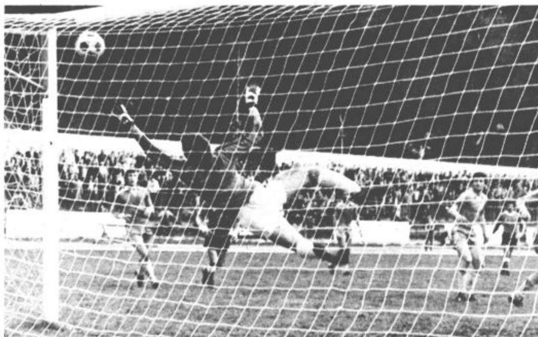
Bo spomladi še več golov?