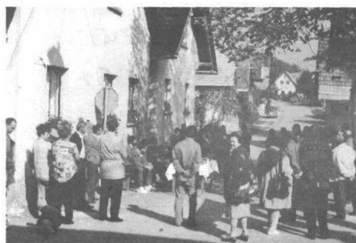
Sprejem pod vasko lipo v Dvorski vasi