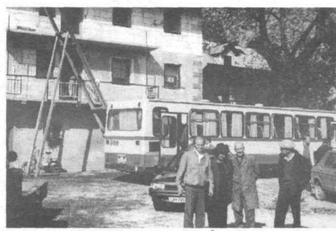
Do Kožarjev je tistega dne prav do domačije Žukovih pripeljal prvi avtobus po čisto novi cestni trasi.