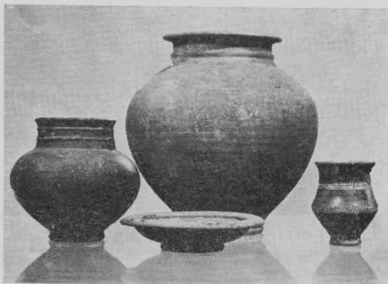
Lončene posode kot pridatki v grobu 59 iz rimskega grobišča na Beletovem vrtu v Novem mestu.

grobov daje slutiti o bogatejšem inventarju v teh izpraznjenih grobovih, ki so se praviloma odlikovali od drugih po svoji velikosti in lepi izdelavi ter bili zato že od vsega začetka za plenilce grobov najbolj privlačni. Po številu pridatkov v intaktnih grobovih lahko sklepamo, da so bili izropani grobovi še dosti bogatejši in zato predvsem zanimivi za roparske skrunilce grobov.