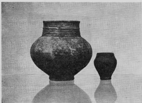
Pogosta kombinacija dveh značilnih lončenih posod v rimskih grobovih na Dolenjskem: večjega lonca z visokim narebrenim vratom in manjšega kozarca. Posodi sta narejeni iz sivočrne gline, izdelek domače delavnice in predstavljata pivski servis.

ljudi v Novem mestu, ki jih najbrž lahko označimo kot keltske Latobike in potomce še starejših Ilirov. Staroselci so po prihodu Rimljanov sicer sprejeli določene njihove civilizacijske dobrine, vendar jih romanizacija in latinizacija vsaj v 1. stoletju še nista prevzela. Kazno je, da so prebivalci Dolenjske pod rimsko upravo v 1. stoletju živeli v miru in gospodarski blaginji. Z najdbami iz Beletovega vrta se je močno obogatila arheološka zbirka Dolenjskega muzeja, Novo mesto pa se je uvrstilo med pomembna provincialna rimska najdišča v Sloveniji.