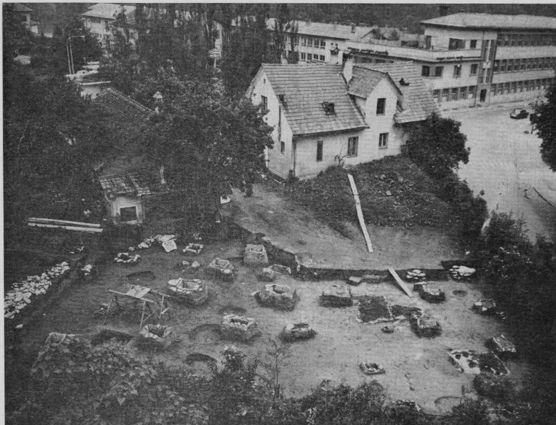
Novo mesto — Beletov vrt. Pogled na del odkrite rimske nekropole z žganimi pokopi poleti 1973.

na večji površini v sklenjeni plasti, pomešani z obilico črepinj mnogih keramičnih posod in razlomljenih ter ožganih kosov bronastega nakita. Ta plast žganine je po našem mnenju ostanek sežigališča-ustrine, prostora, kjer so rimskodobni prebivalci Novega mesta upepeljevali svoje mrtve.