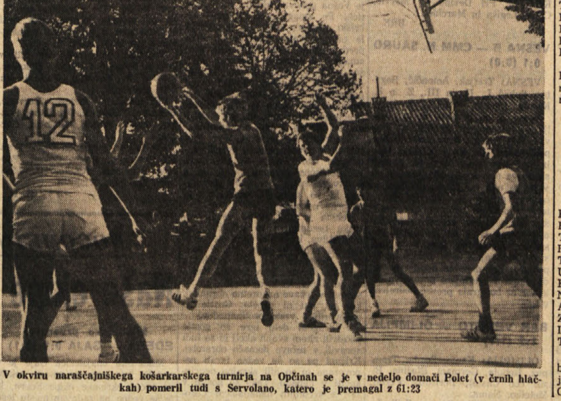
V okviru naračajniškega košarkarskega turnirja na Opčinah se je v nedeljo domači Polet (v črni hlačah) pomeril tudi s Servolano, katero je premagal z 61:23