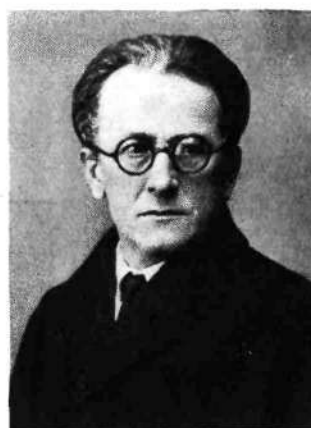
Dr. Ivan Prijatelj

operi. Preživel je težka leta vojne invazije. Ljubljana ga ohrani v lepem spominu.