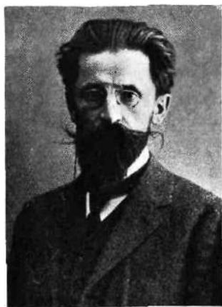
Dr. Fran Ilešič