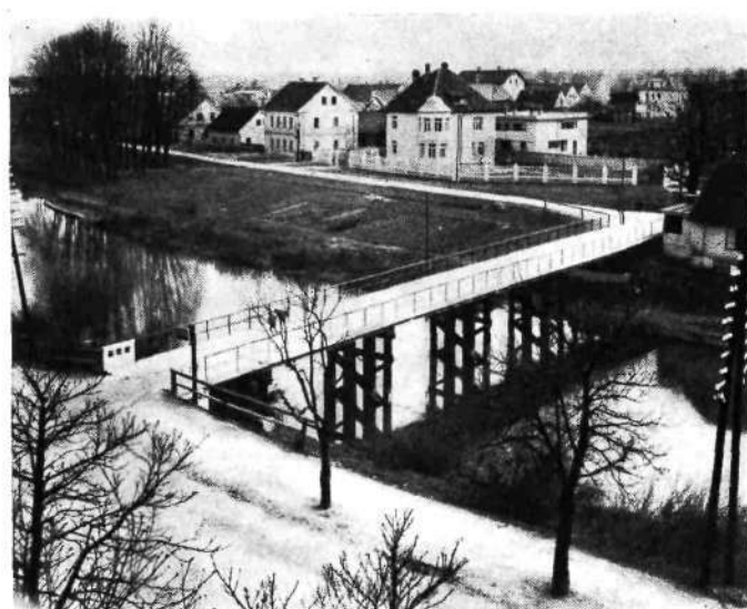
Novozgrajeni most na Prulah

Delni opust mestne aprovizacije ni pokazal dobrih uspehov. Predvsem ni mogoče zajezi naraščajoče draginje. Stalno povišanje plač v vseh panogah gospodarstva dviguje tudi cene vsem, zlasti industrijskim produktom. Najtežje je prizadet kmet, ki mora plačevati drago vse industrijske predmete, zlasti stroje, obleko in obutev. Stanovanjska beda obup prebivalstva še povečuje. Zaupanje v denar pada. Zato se morda tudi prekomerno troši, življenje gre preko okvira možnosti. Skromnost in omejevanje v človeških potrebah je povojni čas izbrisal iz navad, ki so last samo še starih ljudi. Zato starejši ljudje ne razumejo več časa, zlasti pa ne mladine, ki drvi po novih, nezanih potih. Svet pleše na vulkanu in se udaja vsem lastnostim brodolomcev. Politične parole gredo v ekstreme. Gospodarstvo je brez kompasa. Vse hiti v borbi za nečem boljšim, nepoznanem, vse hlasta po blagostanju. Prepadi med stanovi se poglobljajo, na eni strani prenasičenost, na drugi beda in splošno iskanje po Odrešeniku, ki bo rešil in ustvaril — nov svet.