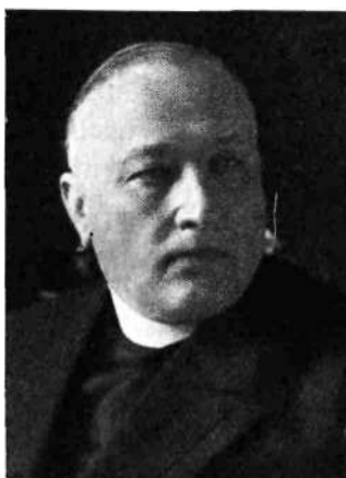
Dr. Anton Korošec