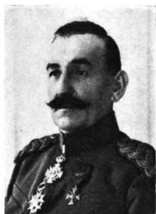
Gen. Krsia Smiljanic

6. na predlog obč. svet. Anton Bončarja se zaprosi deželna vlada, da se podaljša policijska ura in omilijo »naravnost blazno visoke kazni« zaradi prestopkov policijske ure.