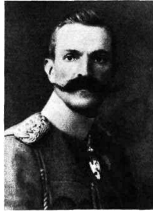
Gen. Rudolf Maister

Regent Aleksander je danes podpisal ukaz, s katerim stopi v veljavo zakon o ustanovitvi vseučilišča