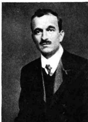
Dr. Josip Plemelj