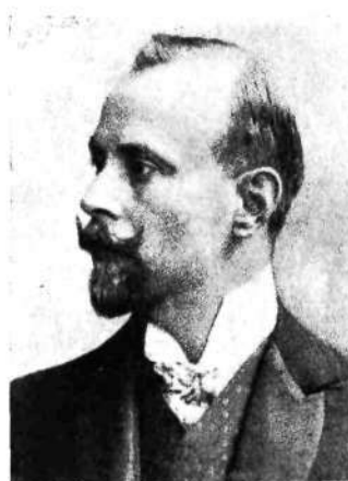
Dr. Ivan Žolger