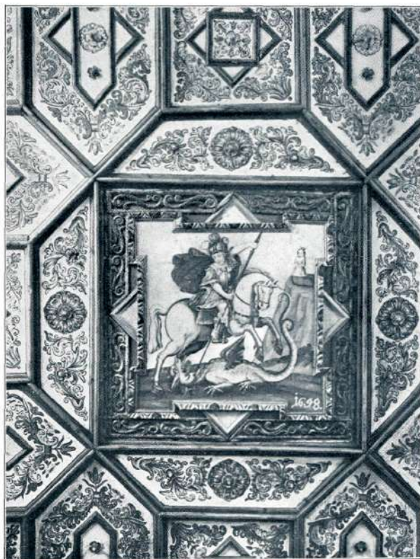
Strop v cerkvi sv. Jurija

(Sv. Peter pri Sv. Primožu nad Kamnikom.)