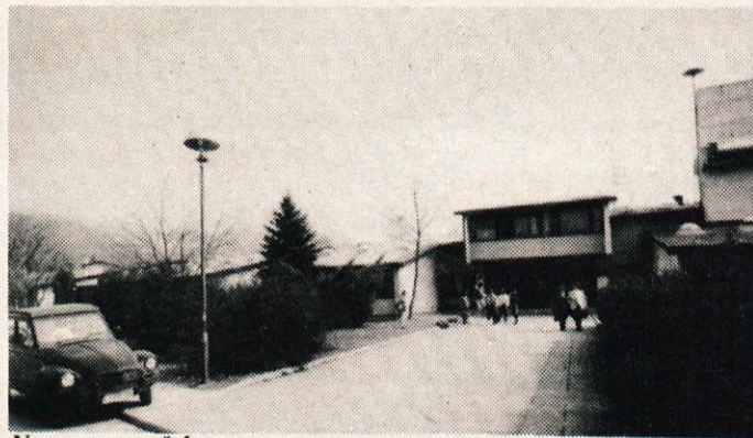
Nova osnovna šola