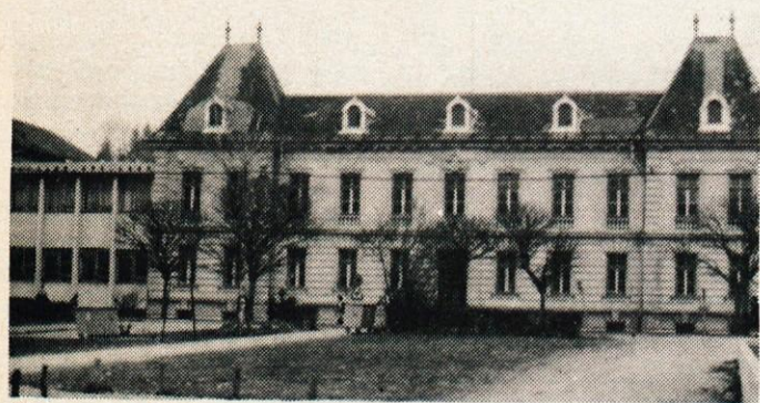
Stara osnovna šola

Zaradi obilice gradiva smo bili prisiljeni del prispevkov prihraniti za naslednjo številko GO, ki bo izšla 21. aprila, prispevke zanj pa bomo sprejemali do srede 8. aprila.